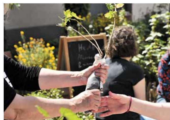
Saatgut tauschen, saisonal kochen, Natur verstehen – die Klimawerkstatt macht Klimaschutz zu etwas, das man anfassen kann.

herzhaftere Optionen wie belegte Brötchen oder warme Toastgerichte. Besonders beliebt ist die entspannte, gemütliche Atmosphäre, die zum Start in den Tag oder für eine kleine Auszeit zwischendurch einlädt. Auch die große Auswahl an Eissorten sorgt dafür, dass sich ein Besuch zu jeder Jahreszeit lohnt.