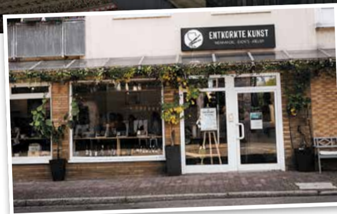
Außenansicht des Ladens in Ginnheim.

In der Stefan-Zweig-Straße 5a lädt das charmante Café Heaven Ice und Bäckerei zum Verweilen