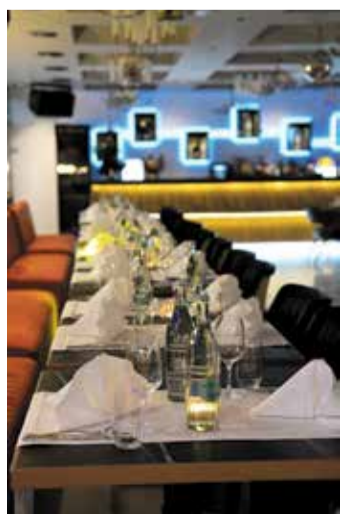
Das elegante Ambiente des Restaurants.

Nachhaltigkeit hat in Ginnheim eine feste Adresse – und die riecht nach Erde, frischen Kräutern und dem leisen Verdacht, dass man eigentlich schon viel früher hätte anfangen sollen. Die Klimawerkstatt Frankfurt, getragen vom gemeinnützigen Ginnheimer Kirchplatzgärtchen e.V., bietet Workshops rund um