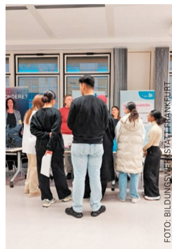
Ein Blick in die letzte #GoFuture-Veranstaltung.

FRANKFURT/GALLUS (RED) | Wie geht es nach der Schule weiter? Antworten darauf bietet die Trägermesse #GoFuture am 22. April 2026. Von 10 bis 15 Uhr wird der StadtRaum Frankfurt (AmkA), in der Mainzer Landstraße 293, 60326 Frankfurt am Main, zum Treffpunkt für Jugendliche und junge Erwachsene zwischen 14 und 27 Jahren. Zahlreiche Träger, Institutionen und Beratungsstellen informieren über Schulabschlüsse, Berufsorientierung, Praktika, Ausbildung sowie Themen wie Arbeit, Wohnen, Finanzen und Gesundheit. Die Messe ist Teil der Initiative „Runder Tisch –