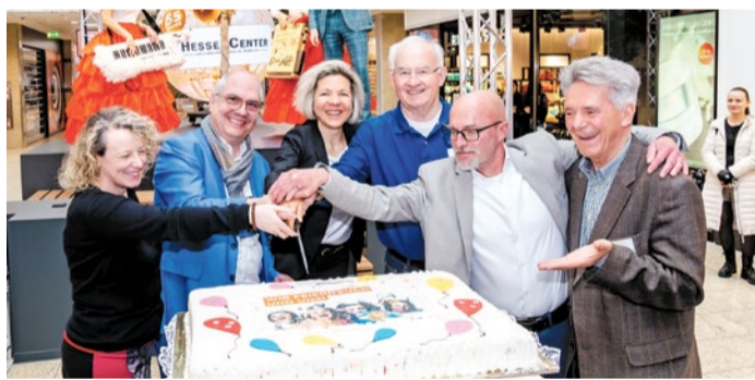
Eine große Geburtstagstorte wurde gemeinsam mit der Wirtschaftsförderung Frankfurt angeschnitten.

Zentraler Bestandteil ist das tägliche Gewinnspiel „Die Glückskugel“ mit Preisen im Gesamtwert von 25.000 Euro. Mehrmals täglich können Besucher ihr Glück bei Quiz- und Zahlenspielen versuchen. Für Unterhaltung sorgen zudem Live-Musik, eine Team-Challenge regionaler Vereine sowie ein Family Day mit Bastelaktionen, Walking Acts und Kinderangeboten. In der Geburts-