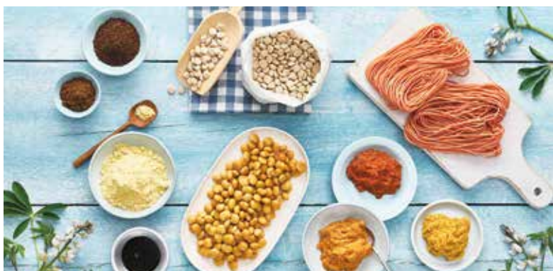
Superfood aus heimischem Anbau: Hülsenfrüchte, in der Fachwelt als Körnerleguminosen bekannt, sollten ein- bis zweimal wöchentlich auf dem Speiseplan stehen.

Wer etwas mehr kocht, kann die gegarten Hülsenfrüchte portionsweise einfrieren und hat damit die Basis für ein ganz schnelles Essen geschaffen. Die EU-kofinanzierte Kampagne „Die Vier von hier – Körnerleguminosen aus Europa für eine nachhaltige Ernährung“ bietet unter www.dieviervonhier.eu ausführliche Informationen zum Anbau, zu Nährwerten und Nachhaltigkeit sowie zahlreiche alltagstaugliche Rezepte.