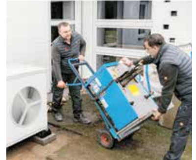
Alte Heizung raus, moderne Wärmepumpe rein: Dieser Umstieg zahlt sich gleich mehrfach aus.

Anschließend folgt ein Angebot von einem Fachhandwerker vor Ort: Er ist Vertragspartner, wird die Anlage installieren und steht danach weiterhin für alle Fragen zur Verfügung, so Frank Röder weiter: „Im