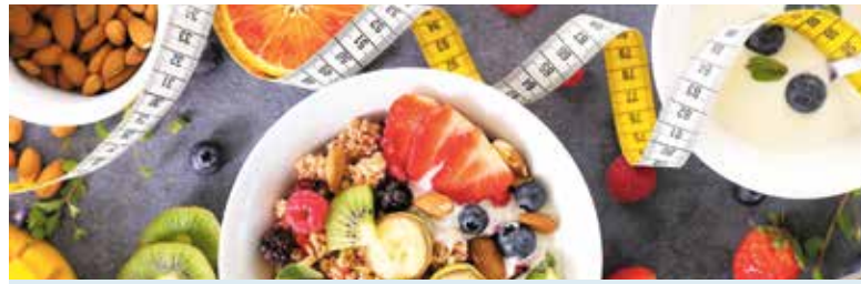
Eine basische Ernährung mit frischem Obst, Gemüse, Nüssen und Vollkornprodukten wirkt einer Übersäuerung bei Diäten entgegen.

(DJD). Gesünder essen, mehr bewegen und in leichten Outfits eine gute Figur machen: Hochmotiviert starten viele Menschen in ihre Frühlingsdiät. Anfangs läuft es meist auch gut, die ersten Pfunde purzeln wie gewünscht. Doch dann, nach einigen Wochen, herrscht plötzlich Stillstand. Trotz Verzicht und Disziplin zeigt die Waage immer dieselbe Zahl. Frustration macht sich breit.