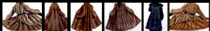
Bisam • Persianer • Fuchspelze aller Art • Zobel • Nerze • Nutria • Chincilla