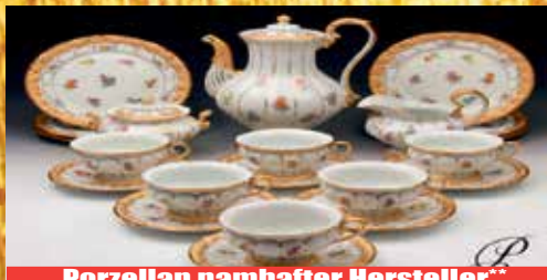
Porzellan namhafter Hersteller**