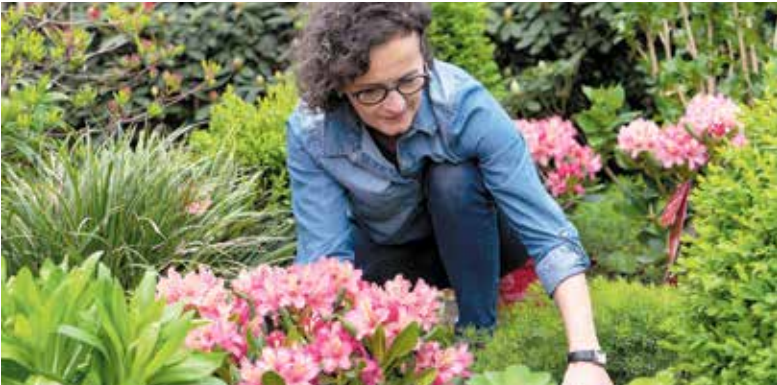
Farbenfroh und pflegeleicht: Rhododendren machen im Beet, im Kübel oder als Pflanzhecke eine gute Figur.

Warum Rhododendren heute auch ohne Gartenerfahrung gelingen