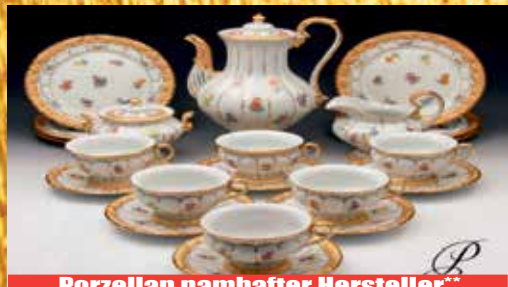
Porzellan namhafter Hersteller**