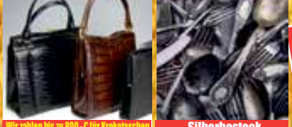
Wir zahlen bis zu 800,- € für Erbkasschen