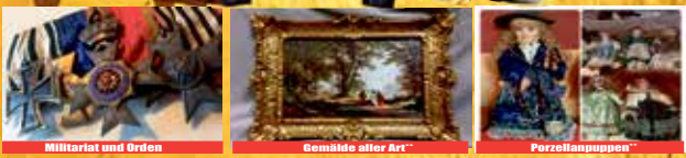
Militärat und Orden