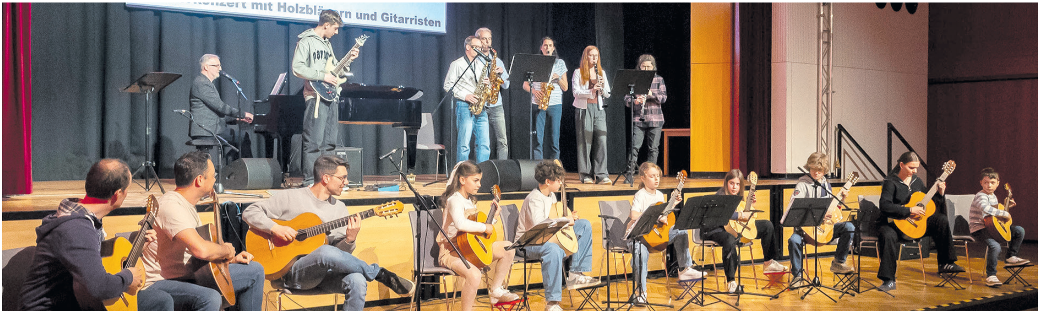
Abschlusslied mit allen Konzertteilnehmern.