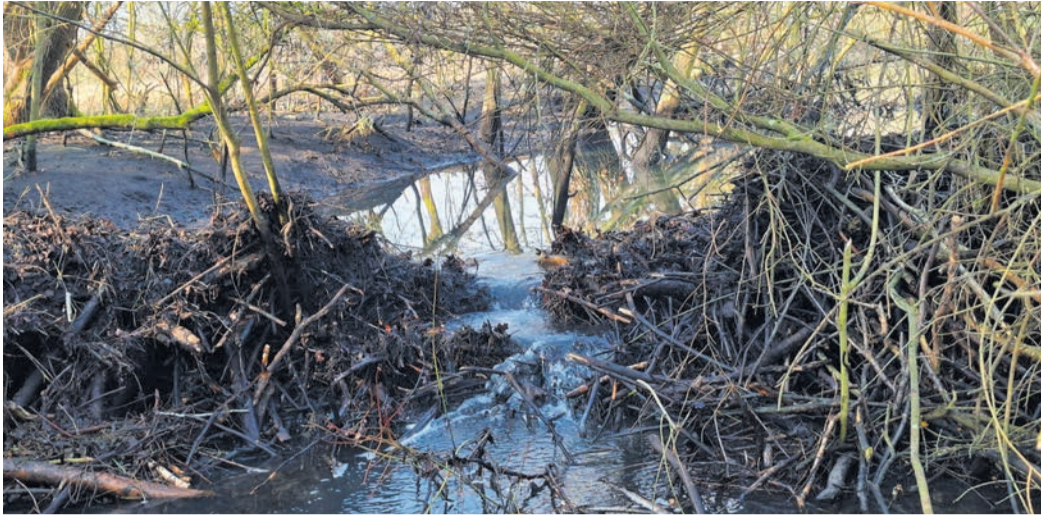
Die Zerstörung des Biberdamms wurde bei der Polizei zur Anzeige gebracht.

Nun folgte leider eine Überraschung im negativen Sinn: Der Biberdamm wurde erheblich beschädigt beziehungsweise zerstört. Bei einer Begehung durch Vertreter der Stadt und des NABU Obertshausen am Donnerstag, 5. März, war in der Dammmitte eine „Senke“ zu erkennen, durch die Wasser floss. Zu einem massiven Eingriff durch Unbekannte muss es vermutlich in der Nacht von Freitag (6. März) auf Samstag (7. März) gekommen sein. In der Folge kam es zu einem Bruch am Hauptdamm im Mühlgraben am Rand des Naturschutzgebiets Gräbenwäldchenfeld. Seitdem ist der Wasserstand