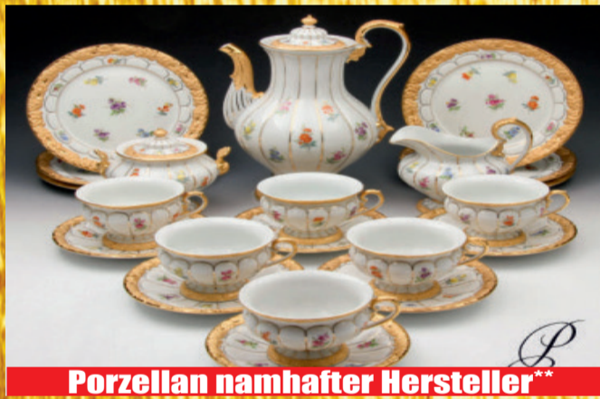
Porzellan namhafter Hersteller**