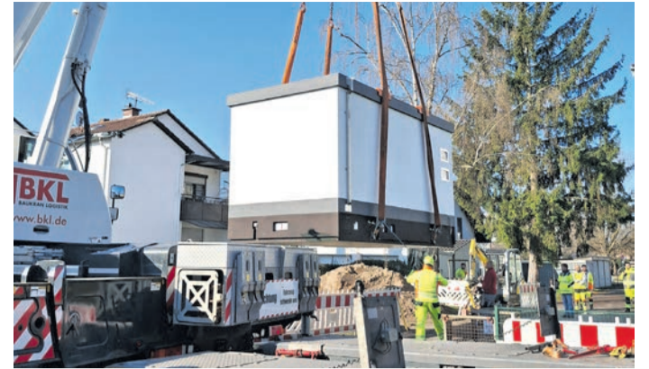
Mit Hilfe eines Krans wurde das Glasfaser-Verteilergebäude sicher an seinem Standort an der Albert-Schweitzer-Straße platziert.