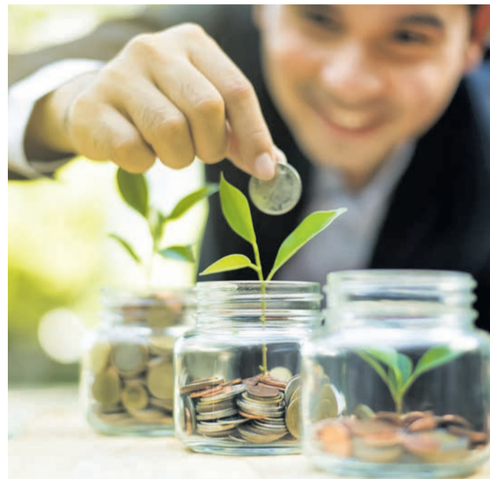
Geld, das wächst: Mit Volks-Invest investieren Sie nicht nur in stabile Renditen, sondern auch in eine nachhaltige Zukunft

Bei Zinsen nahe null und einer Inflation, die Ihr Ersparnis Jahr für Jahr entwertet, ist das klassische Sparbuch längst kein sicherer Hafen mehr. Gleichzeitig boomen Private-Market-Investments, also direkte Beteiligungen an realen Projekten wie Solarparks, Immobilien oder Unternehmen. Diese Anlagen werfen stabilere Erträge ab als Aktien, sind weniger volatil und oft inflationsgeschützt. „Unser Ziel ist es, diese Chance zu demokratisieren“, sagt Markus Echternach von der EGRO