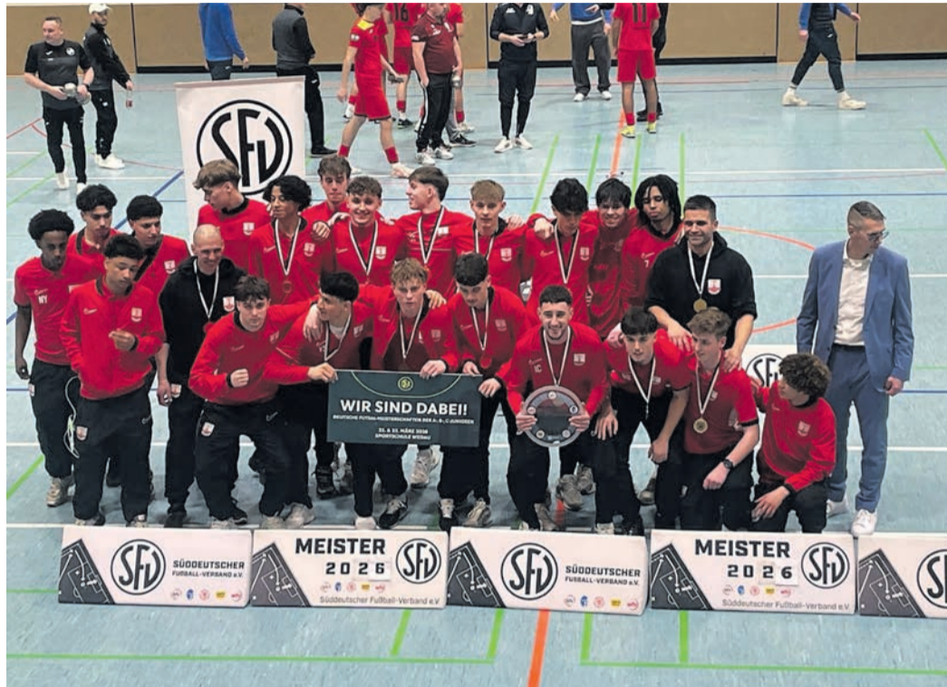
Die A-Junioren der TS freuten sich über Platz eins bei der Süddeutschen Meisterschaft.

Das zweite Spiel gegen den SV Waldeck-Obermenzing München hatte bereits eine vorentscheidende Bedeutung. Ober-Roden setzte sich gegen den späteren Zweiten mit 3:2 durch. „Das war eine sehr in-