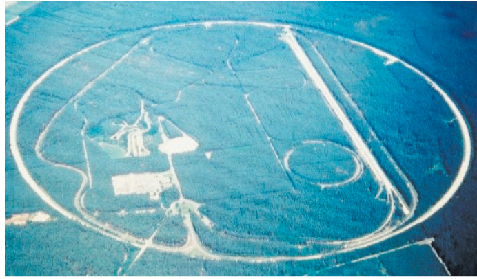
Das Opel-Testfeld aus der Vogelperspektive.