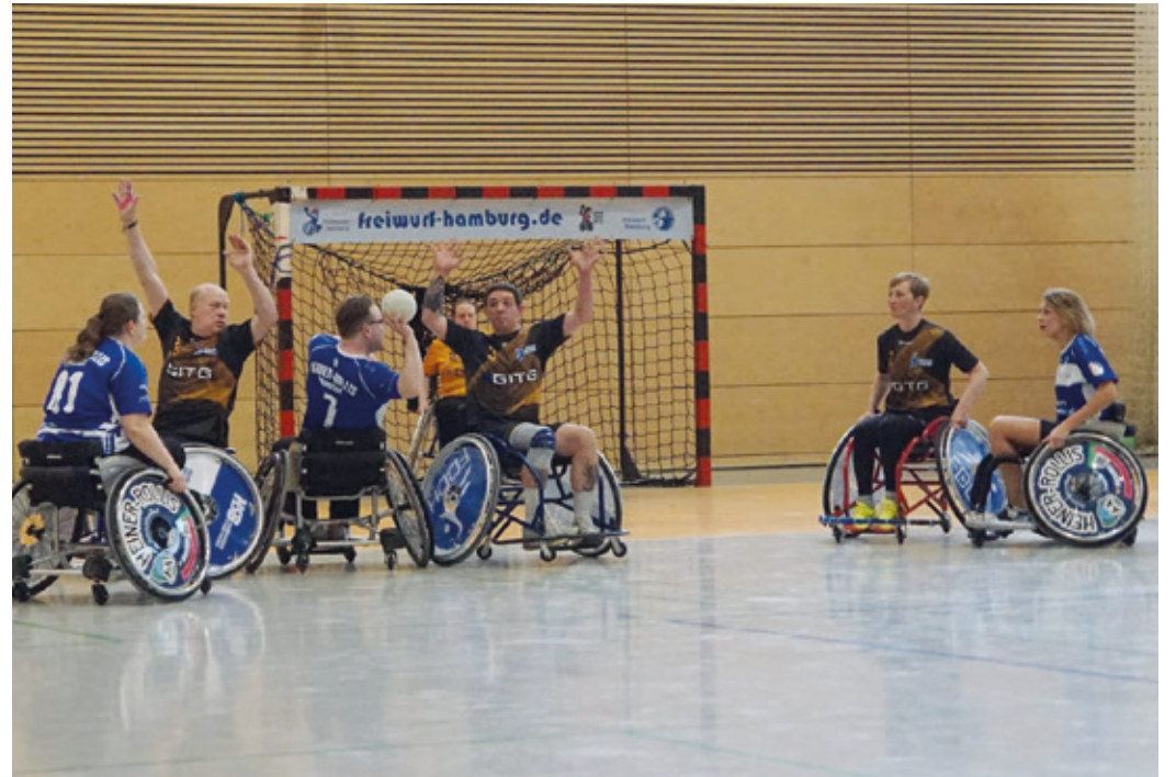
Heiner-Rollis im Angriff gegen Freibeuter Hamburg.

Darmstadt (mh). Am vergangenen Samstag (28.03.) nahmen die Heiner-Rollis, Hessens erste inklusive Rollstuhlhandballmannschaft, am 3 Königsturnier in Hamburg teil. Ursprünglich sollte das Turnier bereits am 10. Januar stattfinden. Der Ausrichter, die Freibeuter Hamburg, musste den Termin jedoch kurzfristig absagen, nachdem die Stadt Hamburg die Halle aus Sicherheitsgründen gesperrt hatte – das Dach war aufgrund der hohen Schneelast gefährdet. Zusätzlich stellte die Deutsche Bahn ihren Zugverkehr in den Norden ein, sodass auch die Anreise unmöglich wurde. Fahrzeuge und Unterkünfte mussten daraufhin im Januar storniert oder umgebucht werden.