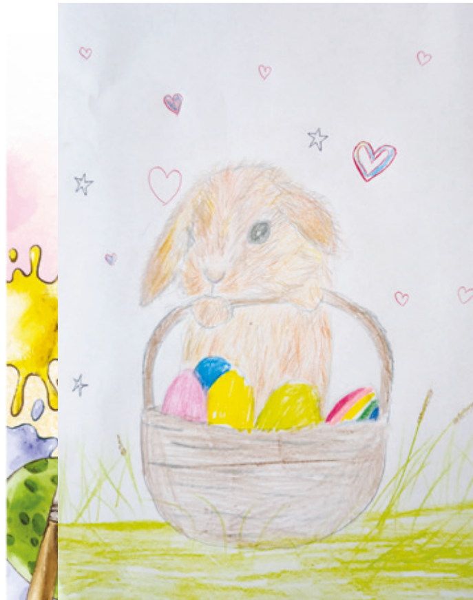
Ida, 10 Jahre