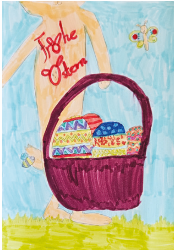
Leni, 9 Jahre aus Wixhausen