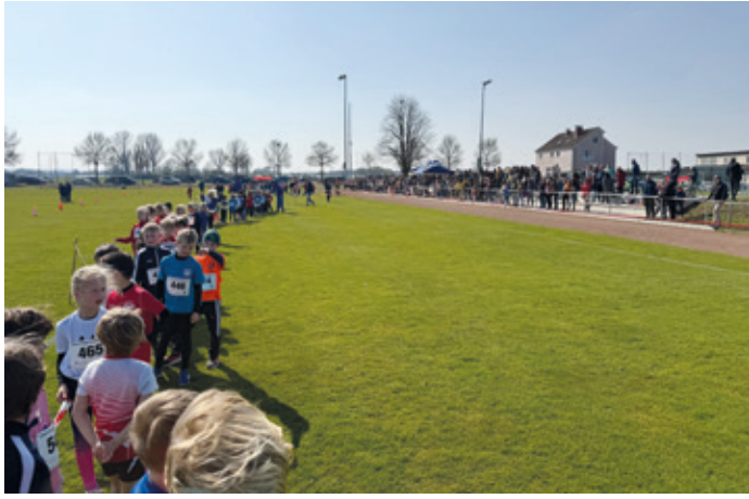
2-Hügel-Crosslauf 2026 auf dem Sportplatz Wixhausen.