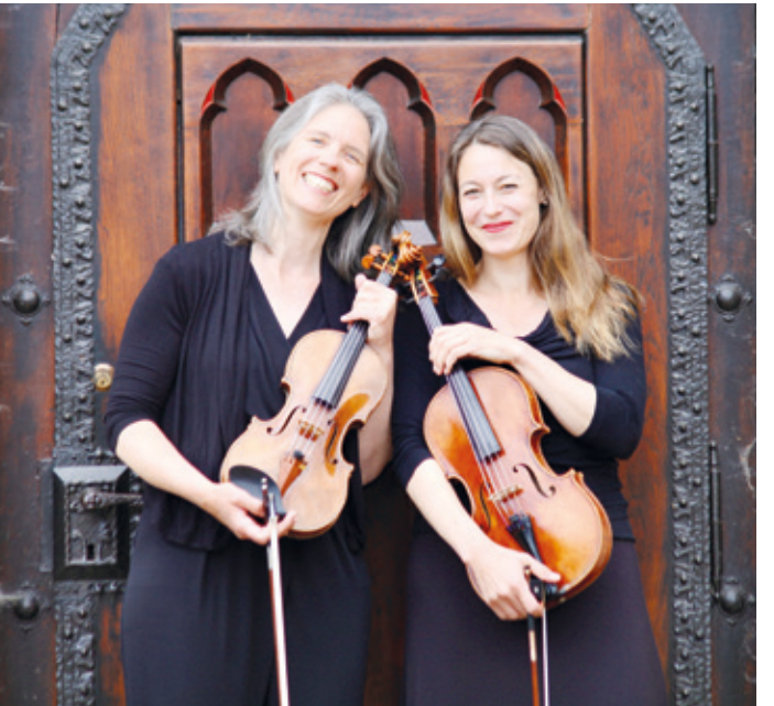
Streichzarte Klänge auf 8 Saiten mit dem „Duo Carphelia“ mit Werken von Sibelius, Mozart, Brustad, Martinu, Pleyel und Halvorsen.

Darmstadt (rh). Am Samstag, 11. April 2026, verwandelt sich das Foyer des Großen Hauses im Staatstheater Darmstadt in einen Ort feinsten Kammermusik: Von 15.30 bis 17.30 Uhr präsentiert das Duo Carphelia ein Konzert für Viola und Violine, das Liebhaber klassischer Musik gleichermaßen wie Neugierige ansprechen dürfte.