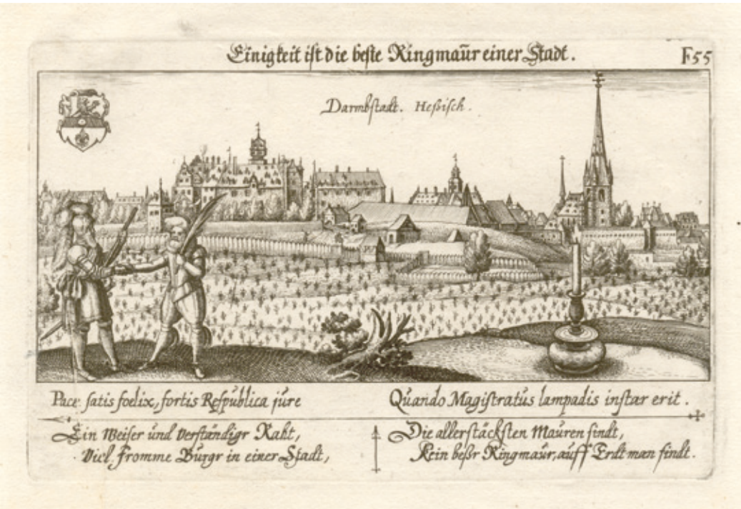
Stadtansicht Darmstadt von 1626 mit der ältesten überlieferten Ansicht der evangelischen Stadtkirche.