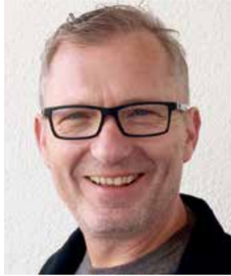
von Volker Zaborowski, Chefredakteur

Eisige Kälte, die Hände wärmen sich an einer Tasse Glühwein, Schneeflocken rieseln geräuschlos gen Boden, süße Weihnachtsklänge machen die Stimmung perfekt. So oder so ähnlich stellen wir uns – ganz nach Bilderbuchmanier – den Weihnachtsmarkt vor, auch wenn er bei uns im Odenwald mal Nikolausmarkt, Christbaummarkt oder Lichterweihnacht heißt. Doch wie so oft in den letzten Jahren ist die Realität eine etwas andere. Relativ