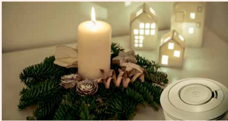
Für eine sicherere Weihnachtszeit empfiehlt es sich, Rauchmelder rechtzeitig zu prüfen.

*Quelle: www.gdv.de/gdv/medien/medieninformationen/advent-weihnachten-braende-statistik-184282