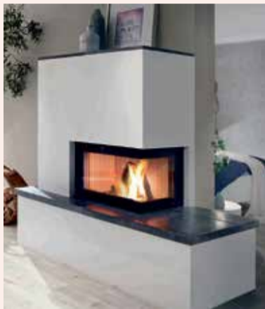
Schlanker Heizkamin mit Speicher – stark auf kleinem Raum.

(akz-o) Für den Einbau einer Kaminanlage war bislang vor allem eines gefragt: viel Platz. Doch gerade in Ballungsräumen wird aus Kostengründen jeder Quadratmeter Wohnfläche genau kalkuliert. In Stadtwohnungen oder kleinen Räumen wird es daher schnell eng, wenn ein Kamin eingeplant werden soll. Für solche Gegebenheiten hat Leda, einer der führenden deutschen Hersteller hochwertiger Ofentechnik, den Kamineinsatz Fina entwickelt.