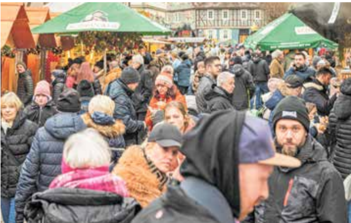
Mitten im Dorf frohlocken 30 Marktstände, Gesänge und Posaunenklänge, Weihnachtskarussell, Benznickel, Kleindampfbahn und tausend winterliche Genüsse die Menschen aus Nah und Fern.

MEHRERE ENSEMBLES GESTALTEN MUSIKALISCHEN ABEND