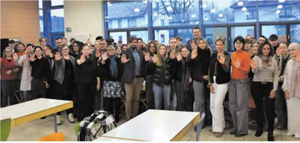
„Wir sagen Stopp“: Mit ihrer Hand drücken Schüler der Ernst-Göbel-Schule in Höchst bei einem Aktionstag ihr Nein zu Gewalt an Frauen und Mädchen aus – gemeinsam mit Lehrern sowie Gästen aus mehreren Organisationen, der Polizei und der Gemeinde. Anlass war der Internationale Tag gegen Gewalt an Frauen und Mädchen am 25. November.