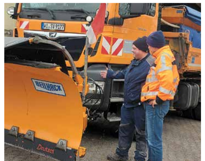
Organisatoren und Arbeiter sind bereit für den Winterdienst.

Er appellierte an alle Verkehrsteilnehmer, ihre Fahrweise den winterlichen Bedingungen anzupassen. red