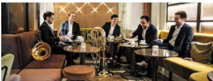
Das Ensemble Frankfurt Radio Brass des hr-Sinfonieorchesters.