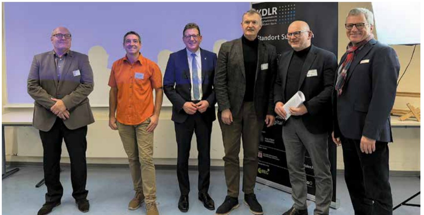
Am 1. Dezember wurde in Michelstadt feierlich der Südhessen-Standort des KDLR eröffnet.