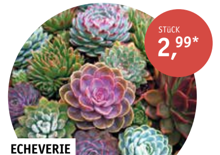
ECHEVERIE verschiedene Arten und Sorten | aus eigener Anzucht | Topf-Ø 11 cm