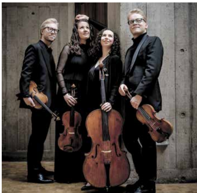
Das Marmen Quartet tritt am 18. Januar in der Werner-Borchers-Halle in Erbach auf.

INTERNATIONALES ENSEMBLE ERÖFFNET ZWEITE SAISONHÄLFTE