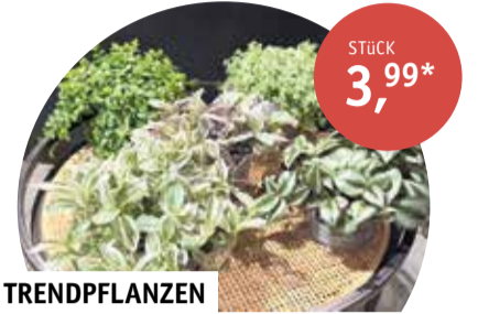
TRENDPFLANZEN trendige Grünpflanzen z. B. Zebrablatt, Pilea | verschiedene Sorten | Topf-Ø 11 cm | ohne Übertopf und Deko