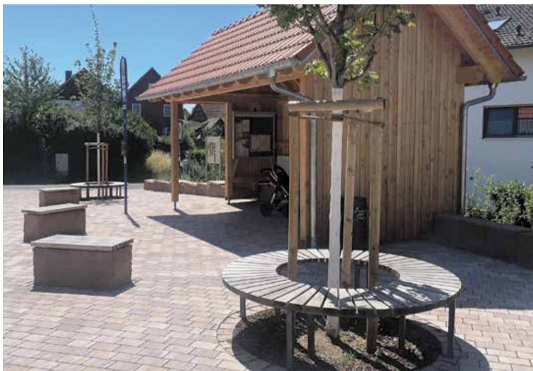
Ein gelungenes Beispiel von vielen: der mit Fördergeldern aus dem Dorfentwicklungsprogramm neu gestaltete Dorfplatz in Höchst-Hassenroth an der Kreuzung Darmstädter Straße/Ringstraße. Der auch „Dreschplatz“ genannte Bereich wurde im Juni 2025 fertiggestellt. Der Platz dient als Treffpunkt und lädt zum Verweilen ein.

„Unsere Dörfer sind weit mehr als reine Wohnorte – sie sind Heimat, soziale Ankerpunkte und Räume, in denen Zukunft konkret gestaltet wird“, betont der Landrat. „Das Dorfentwicklungsprogramm bietet die Chance, gemeinsam mit den Menschen vor Ort Antworten auf die zentrale Frage zu finden, wie gutes Leben im Odenwald auch künftig gelingen kann. Zahlreiche erfolgreiche Projekte aus früheren Dorferneuerungen in unserem Landkreis zeigen eindrucksvoll, welches Potenzial in dieser gemeinschaftlichen Entwicklung steckt.“ Die zuständige Abteilung im Landratsamt steht interessierten