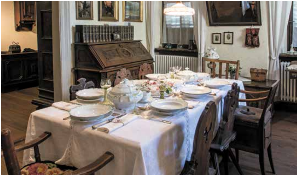
Blick in die „gute Stube“ im Museum in Reinheim.

VEREIN PRÄSENTIERT FAST 300 KULTURANGEBOTE