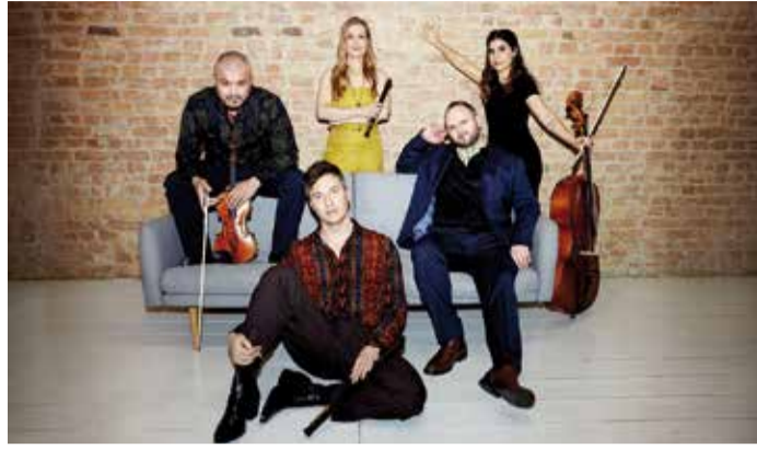
Die Band SPARK kehrt mit dem Programm „Bohemian Spirit“ nach Erbach zurück.

Erbach. Zum Abschluss der Konzertsaison 2025/2026 der Erbacher Konzerte in der Elfenbeinstadt kommt das preisgekrönte Ensemble SPARK nach Erbach. Am Sonntag, 22. März, gastiert die Formation mit ihrem Programm „Bohemian Spirit“ in der Werner-Borchers-Halle. Das Ensemble war bereits vor zwei Jahren in Erbach zu erleben und kehrt nun mit einem neuen musikalischen Konzept zurück. Mit einem außergewöhnlichen Instrumentarium aus verschiedenen Blockflöten, Melodica, Violine, Viola, Violoncello und Klavier entführt SPARK das Publikum in die Welt der Bohème – ein Lebensgefühl, das seit dem 19. Jahrhundert für künstlerische Freiheit, Individualität und kreative Selbstverwirklichung steht. Im Mittelpunkt des Programms steht die musikalische Aufbruchsstimmung, die ihren Ursprung im Paris des frühen 19. Jahrhunderts hat. Das Ensemble verbindet dabei unterschiedliche Stile und Epochen miteinander: