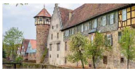
Michelstadt Bund fördert Sanierung der historischen Kellerei Seite 13