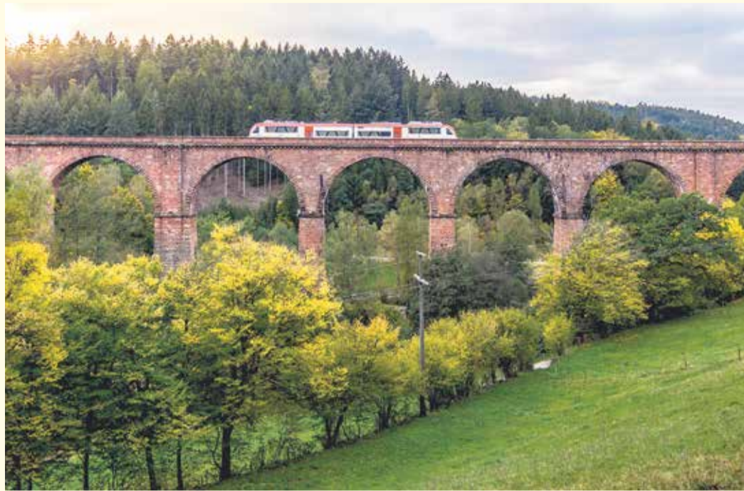
Für die damalige Zeit eine Meisterleistung, für die Region der Anschluss an das Umland: das Himbächel-Viadukt.

Eingebettet in die waldreiche Landschaft des oberen Mümlingtals, am Fuß des Krähbergs, liegt der Oberzenter Stadtteil Hetzbach – ein Ort, der auf den ersten Blick idyllisch und ruhig wirkt, zugleich aber eine erstaunlich bewegte Geschichte besitzt. Bereits 1353 wurde das Dorf erstmals urkundlich erwähnt. Als sogenanntes Waldhubendorf angelegt, prägen bis heute einzelne Gehöfte, kleine Häusergruppen und weite Wiesen das Ortsbild. Jahrhunderte lang bestimmten Landwirtschaft und kleine Handwerksbetriebe das Leben. Nach dem Dreißigjährigen Krieg arbeiteten manche Bauern zugleich als Wagner oder Leinenweber – ein Hinweis darauf, wie vielseitig die Menschen hier schon früh ihren Lebensunterhalt sicherten.