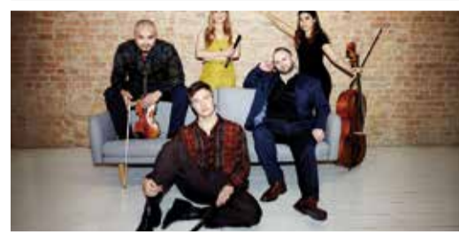
Erbach Klassik-Rebellen erobern Erbach Seite 2