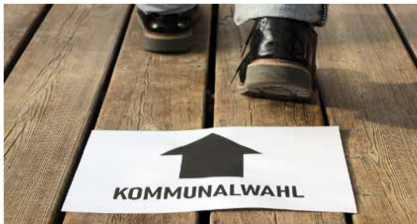
Am Sonntag wählt auch der Odenwaldkreis.

Odenwaldkreis. Am Sonntag richtet sich der politische Blick im Odenwaldkreis auf die Wahllokale. Die Bürger sind aufgerufen, einen neuen Kreistag zu wählen – und damit festzulegen, wer in den kommenden fünf Jahren über zentrale Fragen unseres Landkreises mitentscheidet. Selten wird so unmittelbar sichtbar, wie sehr Politik den Alltag vor Ort prägt.