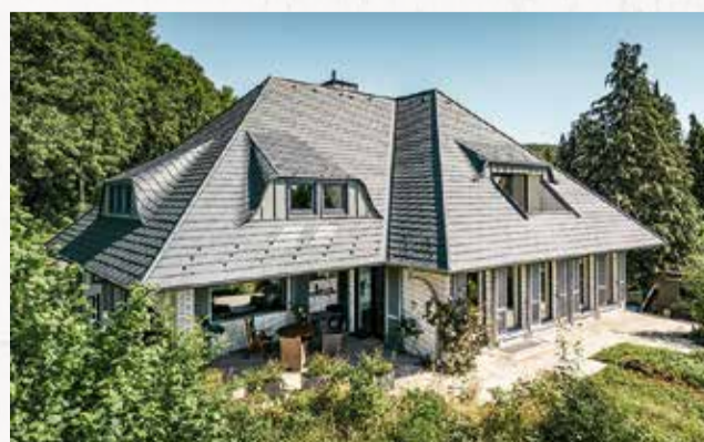
Robuste Aluminiumdächer von PREFA schützen vor jeder Witterung und bleiben dauerhaft schön.

informiert – von den bauphysikalischen Grundlagen über die Planung bis hin zur fachgerechten Ausführung durch den Profi. Mit Hilfe des Leitfadens, der kostenlos bei PREFA bestellt werden kann, lassen sich Sanierungsprojekte erfolgreich umsetzen. Allrounder Metalldach: Der PREFA Dachsanierungs-Ratgeber zeigt alle Vorteile von Platten, Paneelen, Rauten und Schindeln aus Aluminium auf – widerstandsfähig,