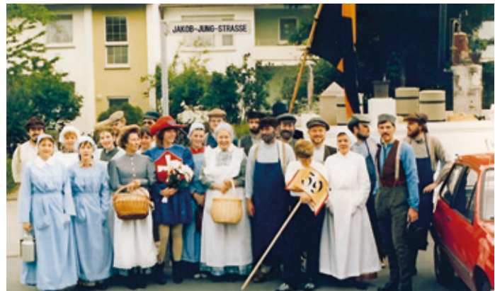
Die Kolpingsfamilie beteiligt sich rege am Stadtleben in „Oarhellje“: Hier die Kolpingsmitglieder, die 1986 am historischen Umzug anlässlich des 1150 Ortstjubiläums teilgenommen haben.

Seit Ende der 60er Jahre hatte die Kolpingsfamilie erste ökumenische Kontakte mit der evangelischen Kreuzkirchengemeinde geknüpft. Nun besuchten Arheilger Kolpingmitglieder auch Gotteshäuser nicht-christlicher Religionsgemeinschaften und informierten sich über den Islam und die jüdische Gemeinde in Darmstadt. Mit Vorträgen und Besichtigungen zu gesellschaftlichen, wirtschaftlichen oder historischen Fragen wurde die Bildungsarbeit intensiviert.