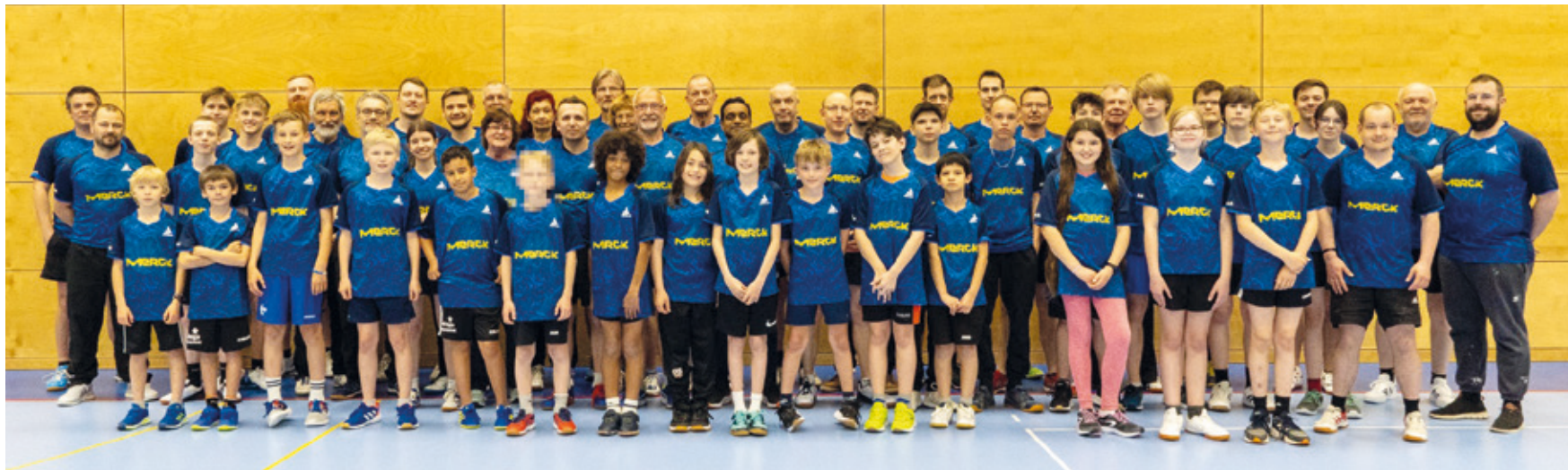
Tischtennisfamilie 2024 – ob jung oder erfahren, Anfänger oder Profi, alle sind willkommen.

Wer an einem Mittwoch- oder Freitagabend unser Merck SGA-Sportzentrum betritt, braucht keinen Lageplan. Man folgt einfach den Geräuschen: klack, klack, Gespräche, Gelächter. Zwei fachsimpeln über einen Aufschlag, der „wirklich ganz sicher“ auf der Linie war, jemand erklärt einem Neuen ruhig, warum Netzroller zwar nerven, aber keinen persönlichen Affront darstellen.