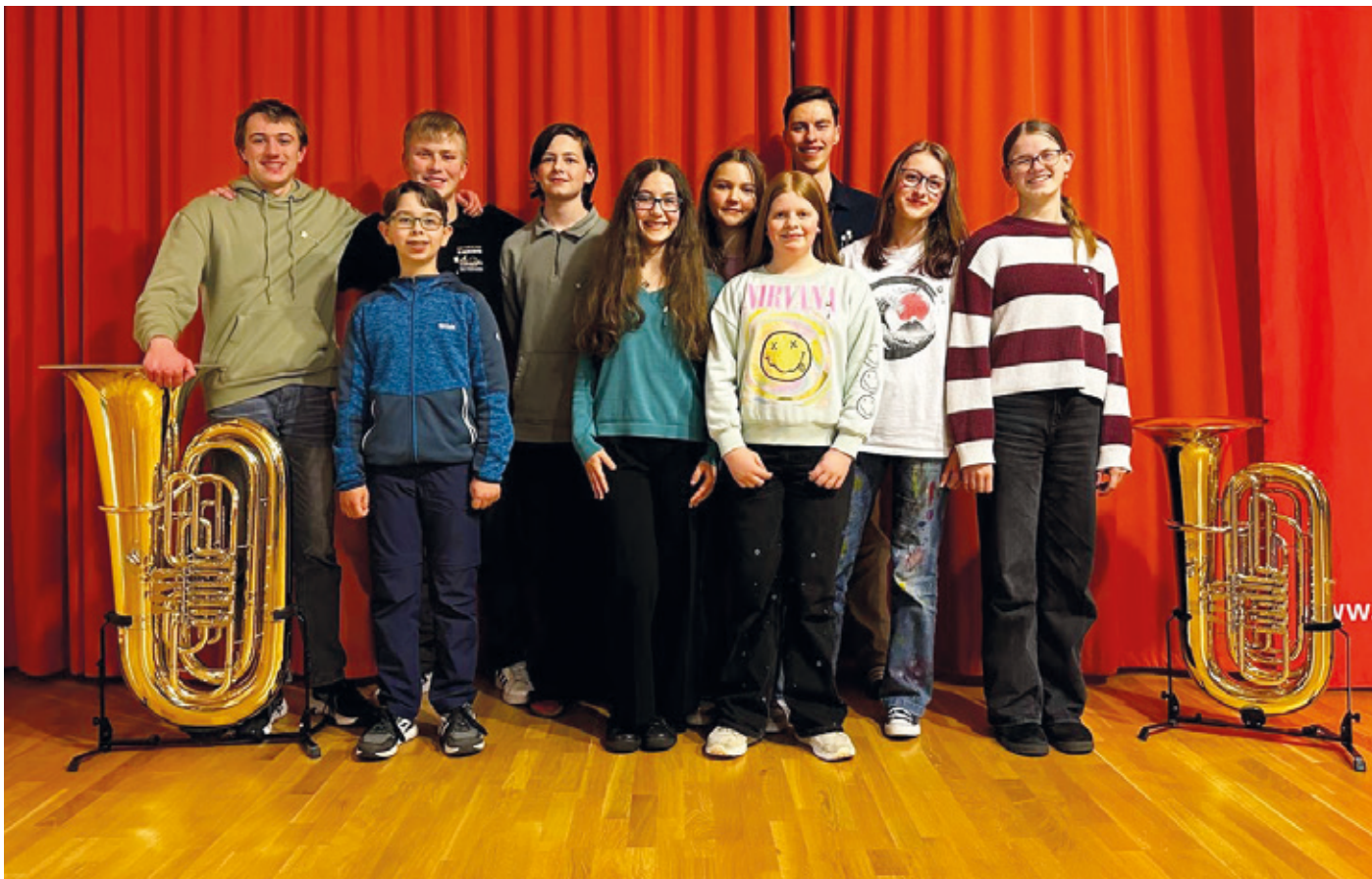
Unsere Teilnehmer*innen am Jugendleistungslehrgang in Alsfeld.