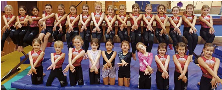
Strahlende Gesichter nach einem tollen Wettkampf