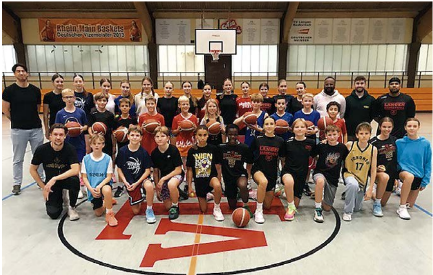
Abschied aus der „Basketball-Halle“ nahmen am 2. Oktober auch diese zwei Teams und „BTI-ler“ und ihre Trainer

Diese besondere individuelle Trainings-Organisation des BTI war bis vor 40 Jahren im Mannschaftssport noch undenkbar. Sie wurde vor 40 Jahren von Trainer*innen des TV Langen für besonders talentierte Mädchen und Jungen offiziell eingerichtet und binnen zwei Jahren von zunächst weiteren Basketball-Vereinen und später dann auch für weitere Team-Sportarten offiziell gestartet. Doch dem BTI e.V. im TV Langen bleibt in Deutschland der Gründer-Status.