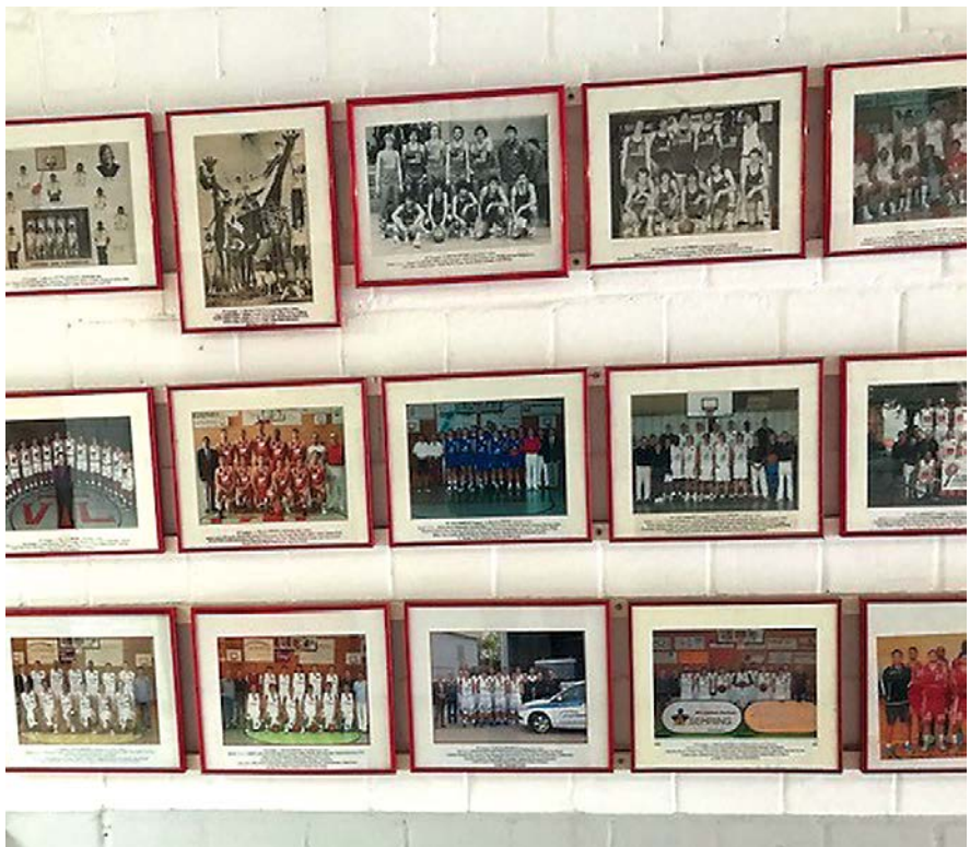
Alle Jahre Bundesliga wurden mit Team-Bildern in der Georg-Sehring-Halle gewürdigt und festgehalten.

Diese sportlichen Erfolge sind es alle weiterhin auch nach dem Hallenumzug wert, in der Sporthalle geehrt zu werden