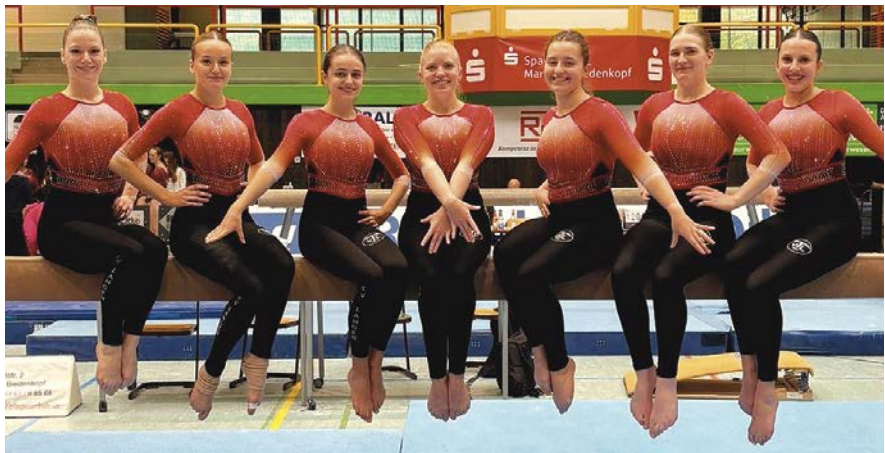
Die Damen der Landesliga 2