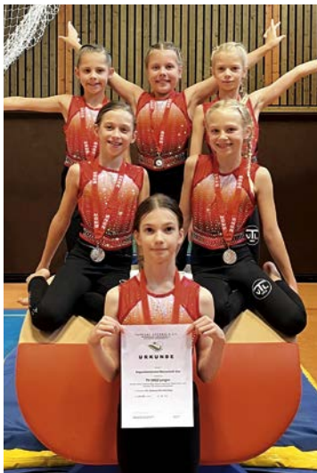
Die P5 holt Gold!