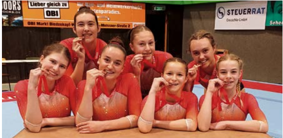
Der TVL behauptet sich in der höchsten Hessischen Landesliga