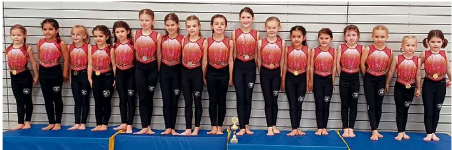
Medaillenregen für unsere Nachwuchsturnerinnen