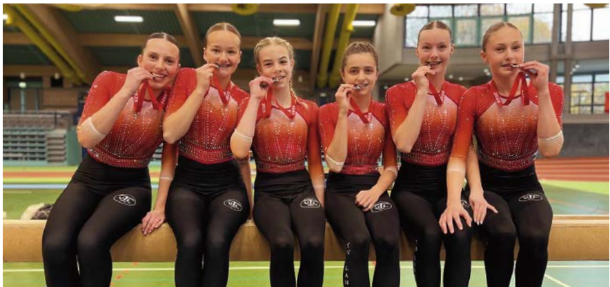
Die Mädels der LK3 freuen sich über Silber