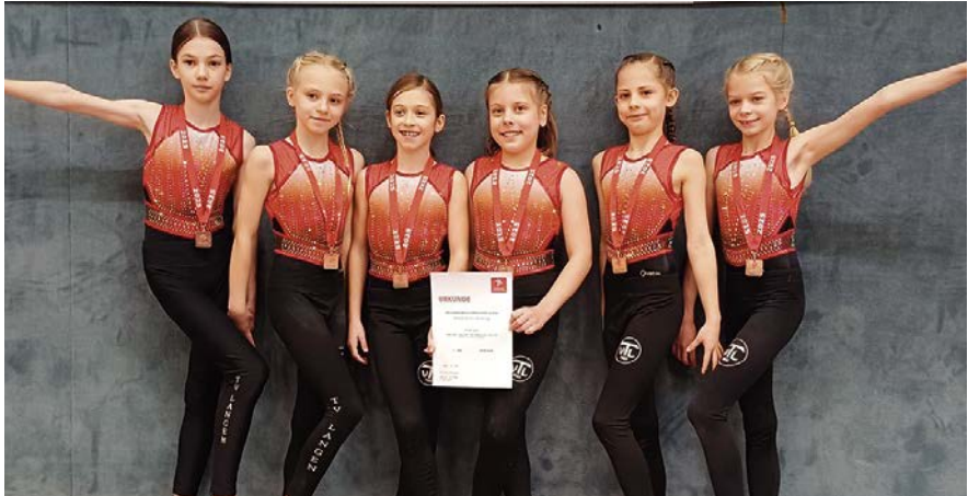
Das Team der P5

nach einer rundum gelungenen Landesfinalpremiere über Platz 7 unter den besten Teams Hessens freuen.