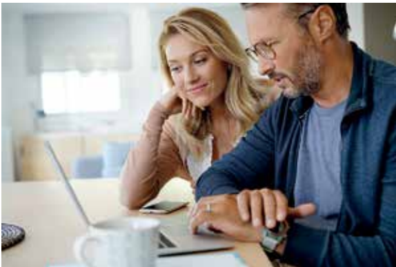
Zur Optimierung ihrer Investments brauchen private Anlegerinnen und Anleger den richtigen Partner, der kompetent berät und das ganze Spektrum an Investmentmöglichkeiten aufzeigt

Darauf sollten private Anleger in einer sich rasant wandelnden Welt achten