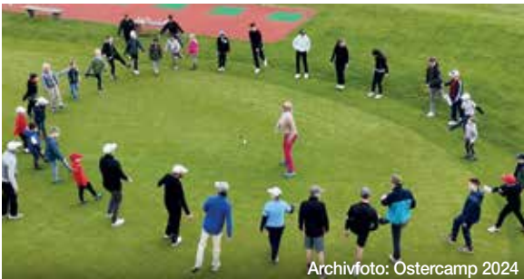
Archivfoto: Ostercamp 2024

Die Veranstaltung findet von Dienstag, 31. März, bis Donnerstag, 2. April 2026, jeweils von 9:30 bis 14:00 Uhr statt. Die Teilnahmegebühr beträgt 120 Euro für Mitglieder und 150 Euro für Nichtmitglieder. Weitere Informationen und Anmeldungen erfolgen über den Proshop des Golfplatzes Altenstadt telefonisch unter 06047 988088 oder per E-Mail an mail@golfplatz-altenstadt.de .