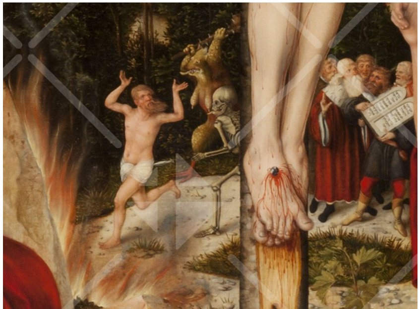
Adam kann Gottes Gebote nicht befolgen, ist gefangen zwischen Wollust, Tod und Höllenflammen

Auf der rechten Seite sieht man Mose und das Volk Israel mit den Gesetzstafeln. Die Tora, die gute Wegweisung Gottes, wurde immer wieder gebrochen; Paulus meinte, sie sei unerfüllbar, so lange wir Menschen von der Sünde beherrscht werden, und wir seien so lange von der Sünde beherrscht, bis uns Gott selber seine Gnade erweist und uns vergibt.