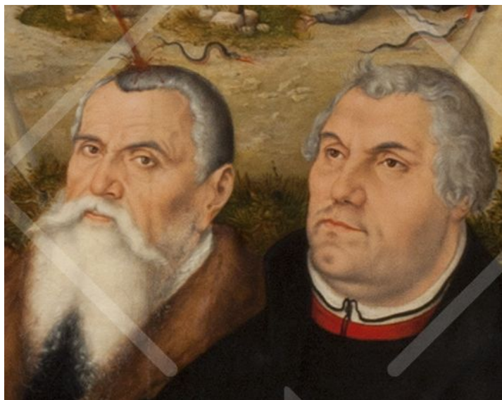
Lucas Cranach und Martin Luther

Schauen wir etwas tiefer, so sehen wir nicht nur, dass die beiden Männer der beginnenden Neuzeit im Gegensatz zu Johannes dem Täufer Beinkleider tragen und sich dennoch eng mit ihm verbunden wissen, sondern auch, dass der Täufer nicht nur mit seiner rechten Hand zum Gekreuzigten zeigt, sondern auch mit seiner linken zu einem Schaf, das vor ihm steht und wie zum Gruß ein Vorderbein erhebt. Hier erinnert der Maler an das Wort von Johannes dem Täufer ( Johannes 1, 29 ):