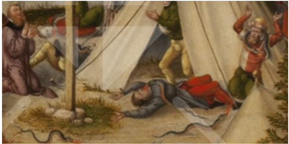
Eine Schlange speit einem, der auf dem Boden liegt, ihr Gift in den Mund.

Lucas Cranach malt diese Szene ziemlich gruselig, indem er darstellt, wie die Schlangen ihr Feuer in den Mund ihrer Opfer hineinspeien; fast sieht es aus, als ob die Schlangen hineinkriechen.