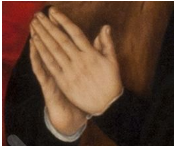
Die zum Beten zusammengelegten Hände des Malers Lucach Cranach

werfe ich in dieser Predigt auf die Hände des Malers Lucas Cranach. Er malt sie als betende Hände, zusammengelegt in dem Vertrauen, dass Gott in Jesus Christus für uns sündige Menschen alles getan hat, um uns zu erlösen, zu retten, zu befreien. Sein Bild will uns dazu anleiten, dasselbe wie er zu tun: dankbar anzuerkennen, was Gott durch das Leiden und Sterben seines Sohnes für uns getan hat, um uns zu einem Leben im Gottvertrauen und in tätiger Nächstenliebe zu befreien. Amen.