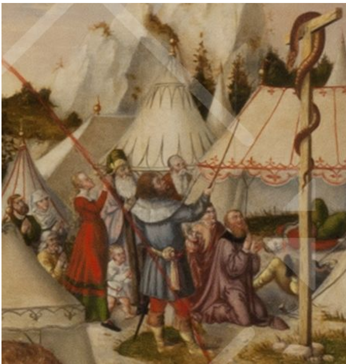
Die eherne Schlange an einem Kreuz

Oder verbrennen sie durch ihr Feuer die Seele dieses Menschen? Jedenfalls erinnern die feurigen Schlangen daran, dass Menschen, die ohne Gottvertrauen leben wollen, jederzeit Gefahr laufen, sich vor der Hölle fürchten zu müssen, vor einem Leben ohne Seele, ohne Sinn, ohne Liebe.