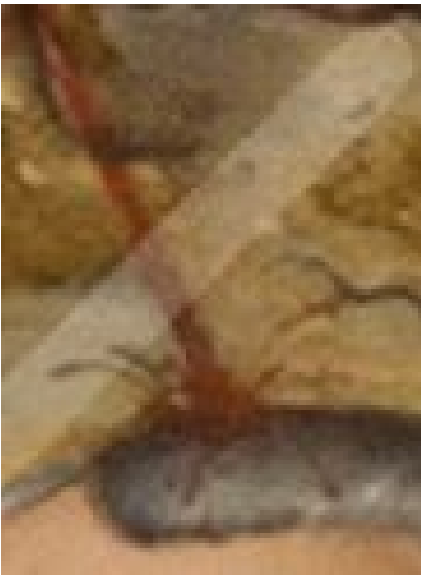
Der Blutstrahl im Bildausschnitt, wie er auf den Kopf von Cranach spritzt

Es wirkt fast komisch, wie naturgetreu der Maler den Blutstrahl wiederzugeben versucht, der von Jesu Seitenwunde auf seinen, Lucas Cranachs eigenen Kopf, hinüberspritzt. Er verzichtet allerdings darauf, zu malen, wie das Blut über sein Gesicht läuft und auf seine Kleider tropft. Dieses Blut ist nicht gewalttätig, der Sieg über Tod und Teufel ist keine blutrünstige Geschichte, in der am Ende derjenige siegt, der die meisten Menschen umgebracht hat. Im Gegenteil, der Jesus, der auf Gewalt und Hass, auf Vergeltung und Rache verzichtet, dessen Blut wird zum Symbol einer Liebe, durch die alle Menschen gerettet sind, die sich von dieser Barmherzigkeit ergreifen lassen.