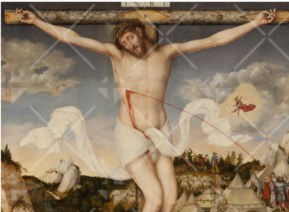
Jesus Christus hängt segnend und Gnade spendend am Kreuz

Der Gekreuzigte – auf dem Bild von Lucas Cranach sieht man sein Leiden, seine Schmerzen, Nägel, Dornenkrone, die Wunde, aus der das Blut spritzt. Aber das Leiden wird nicht übermäßig betont, er will nicht, dass wir uns an der Qual eines Menschen, wie sage ich es richtig, altdeutsch ergötzen oder neudeutsch aufgeilen. Deutlich wahrnehmen sollen wir, wie furchtbar die Folgen der Sünde sind; wer getrennt von Gott lebt, ohne Gottvertrauen, der schreit am Ende „Kreuzige ihn!“, der lässt seinen Freund im