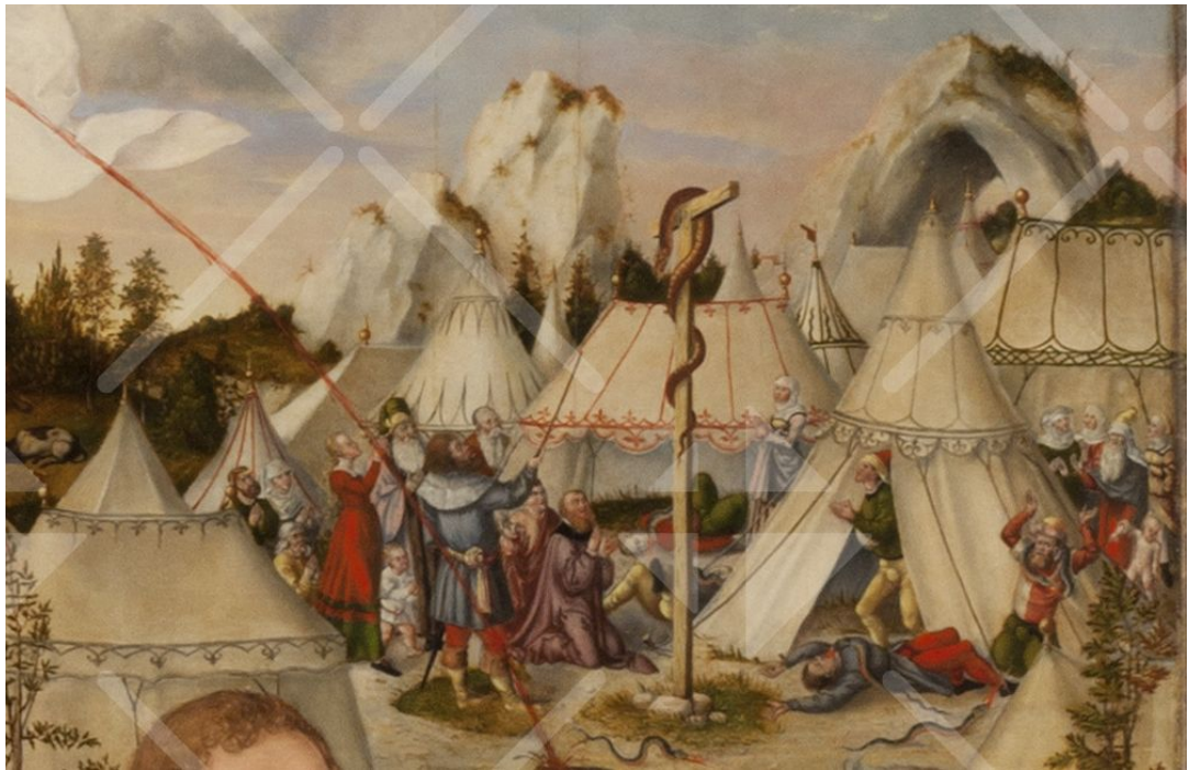
Gift und Feuer speiende Schlangen zwischen den Zelten Israels

Dieser Satz führt zu der Szene aus dem Alten Testament, die rechts im Hintergrund dargestellt ist. Zwischen den Zelten Israels sieht man giftige Schlangen, vor denen