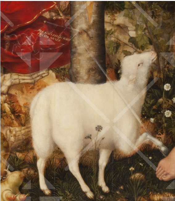
Das Lamm mit der Siegesfahne

gödie, sondern ein zwar trauriges Geschehen, das aber dennoch allen Menschen Heil gebracht hat: die Errettung von Sünde und ewigem Tod.