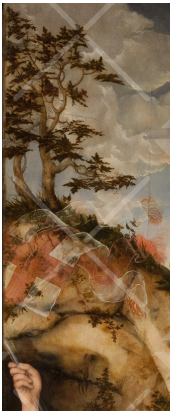
Leichentücher im Wind

Egal, jedenfalls ist Christus nicht mehr im Grab, sondern er ist als der Auferstandene damit beschäftigt, den Teufel zu besiegen. Lucas Cranach malt Jesus hier so ähnlich, wie auf unserem Fensterbild über der Orgelempore der Erzengel Michael dargestellt ist. Damit macht er deutlich: Wenn in der Offenbarung ein Engel den Satan besiegt, dann tut er das nicht aus eigener Kraft, sondern im Auftrag Gottes, der dem Teufel dadurch seine Macht nimmt, dass er sich aus Liebe für die Menschen hingibt und ihnen ihre Sünde vergibt. So gewalttätig es aussieht, wenn Christus in der Pose des Erzengels Michael den Satan mit einem Speer durchbohrt und tötet – diese Darstellung ist symbolisch gemeint. Der Speer ist nicht ohne Grund durchsichtig, wie ein Lichtschwert, er deutet an, dass Jesus den Teufel durchbohrt, indem er sich selbst durchbohren lässt, indem sein eigenes Blut vergossen wird.