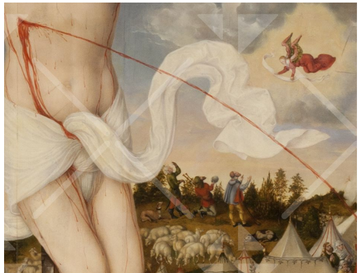
Hirten und Engel von Bethlehem im Hintergrund der Kreuzigungsszene

Und auf der linken Seite des Bildes ist es bereits Ostern... Im Hintergrund sehe ich, wie die Leichentücher im Wind verweht werden, in die Jesus im Grab eingehüllt war. Oder ist das, was da in der Luft gemalt ist, zu eckig für Leichentücher?