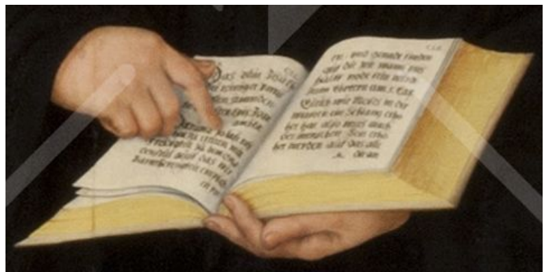
Die aufgeschlagene Bibel Martin Luthers

An dieser Stelle möchte ich einen Blick in das Buch werfen, das Martin Luther aufgeschlagen vor sich hält. Es ist die Bibel, und er zeigt auf drei Sätze, die das Geschehen am Kreuz für uns deuten. Der erste Satz steht in dem Brief 1. Johannes 1, 7 :