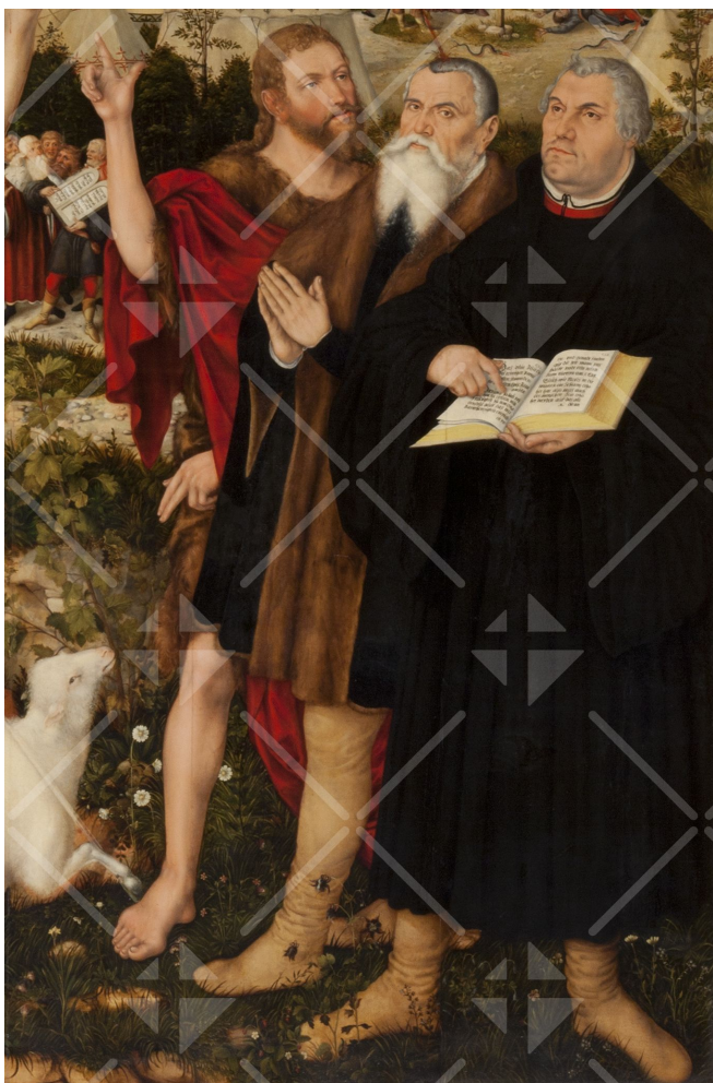
Die Hand des Täufers zeigt auf ein Lamm

Und warum steht Martin Luther neben ihm? Weil er es ist, der ganz ähnlich wie Johannes der Täufer sein ganzes Leben der Aufgabe gewidmet hat, auf die Bedeutung des Gekreuzigten für die Menschen hinzuweisen.