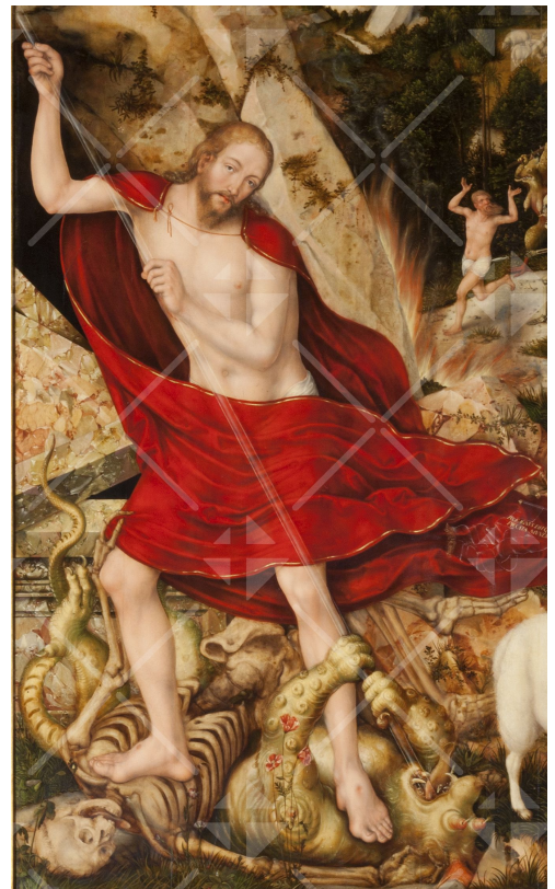
Der Auferstandene tötet wie Michael Tod und Teufel

Egal, jedenfalls ist Christus nicht mehr im Grab, sondern er ist als der Auferstandene damit beschäftigt, den Teufel zu besiegen. Lucas Cranach malt Jesus hier so ähnlich, wie auf unserem Fensterbild über der Orgelempore der Erzengel Michael dargestellt ist. Damit macht er deutlich: Wenn in der Offenbarung ein Engel den Satan besiegt, dann tut er das nicht aus eigener Kraft, sondern im Auftrag Gottes, der dem Teufel dadurch seine Macht nimmt, dass er sich aus Liebe für die Menschen hingibt und ihnen ihre Sünde vergibt. So gewalttätig es aussieht, wenn Christus in der Pose des Erzengels Michael den Satan mit einem Speer durchbohrt und tötet – diese Darstellung ist symbolisch gemeint. Der Speer ist nicht ohne Grund durchsichtig, wie ein Lichtschwert, er deutet an, dass Jesus den Teufel durchbohrt, indem er sich selbst durchbohren lässt, indem sein eigenes Blut vergossen wird.