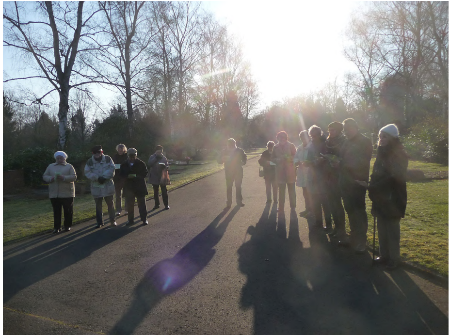
Teilnehmende an der Osterandacht 2015 im Licht der Morgensonne

Zuvor singen wir einige Strophen aus dem Lied 111 . In ihnen geht es darum: nicht nur die Auferstehung Jesu selbst ist ein Wunder, sondern es ist auch ein Wunder, wenn es bei uns Ostern wird, also wenn wir selber von der Osterbotschaft ergriffen werden und nicht nur von Zweifel oder Entsetzen: