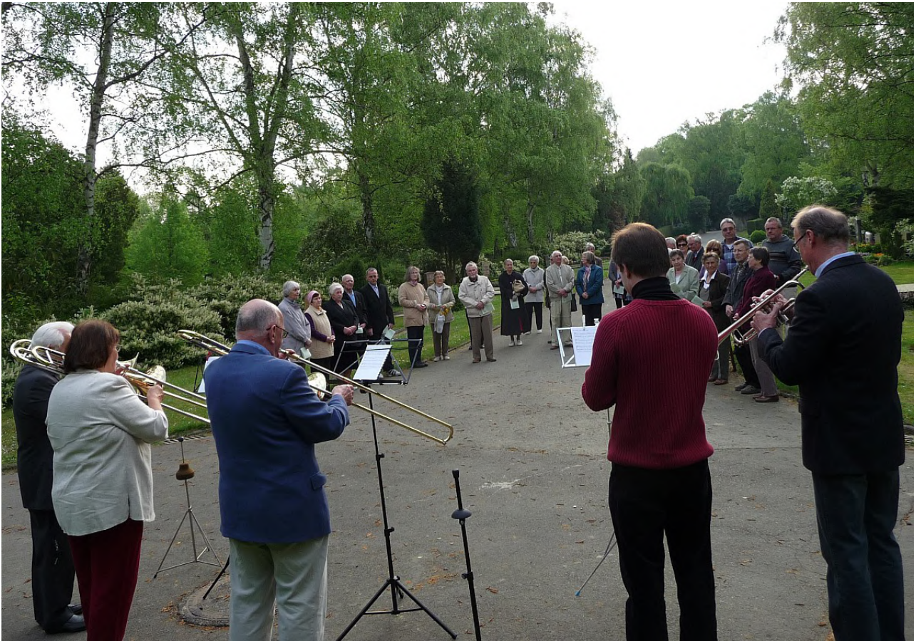
Die am Steinkreuz versammelte Ostergemeinde im Jahr 2011

Liebe Gemeinde, in unseren Osterliedern wird beides eng zusammen gesehen: die Auferstehung Jesu Christi und die Auferstehung der Toten am Ende aller Tage.