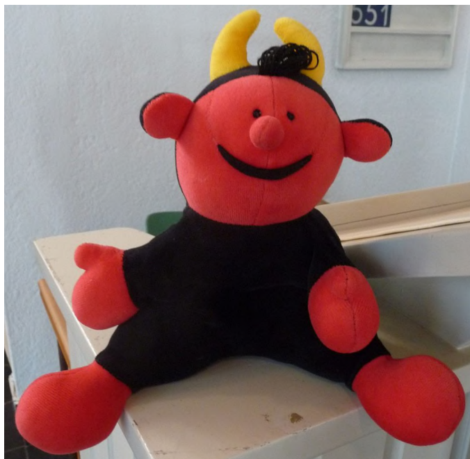
Die Handpuppe Lutz auf der Altarbrüstung der Pauluskirche Gießen

Das stimmt, aber es stimmt auch nicht ganz. Leider kann man ja nichts für seine Verwandten. Ursprünglich war Lucifer ein so strahlend schöner Engel, dass man ihn mit dem Morgenstern am Himmel verglichen hat.