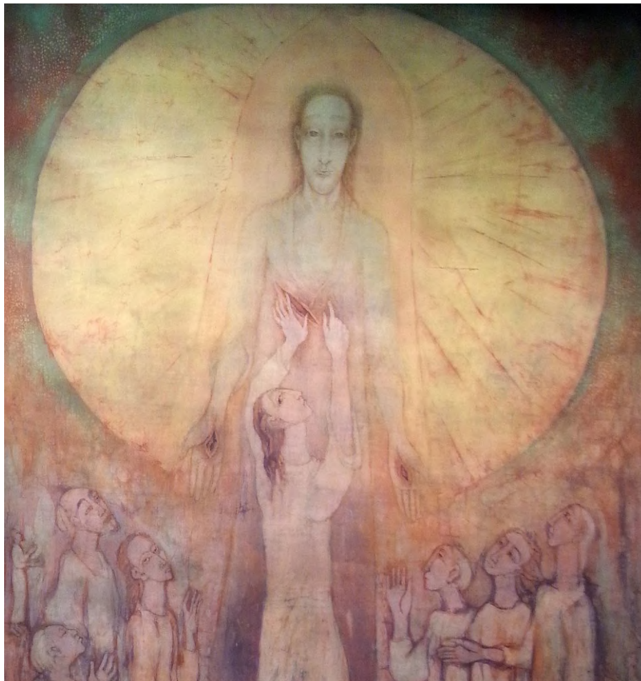
Der Mittelteil des Altarbildes mit Christus und Thomas in der Evangelischen Thomaskirche Gießen

Die Erlaubnis zum Zweifeln verwandelt seinen Zweifel und dreht ihn um – aus dem Zweifler ist ein Glaubender geworden. In dem Menschen, der ans Kreuz genagelt und durchbohrt war, erkennt Thomas Gott selber. Als er Jesus anfassen darf, fühlt er die Qual seines gekreuzigten Leibes und seiner erniedrigten Seele. Er spürt, wie sehr Jesus die Menschen geliebt hat, auch ihn, den Zweifler. Nie zuvor hat sich Thomas seinem Herrn so nahe gefühlt. Er begreift: im gequälten Jesus offenbart sich die Liebe Gottes selbst.