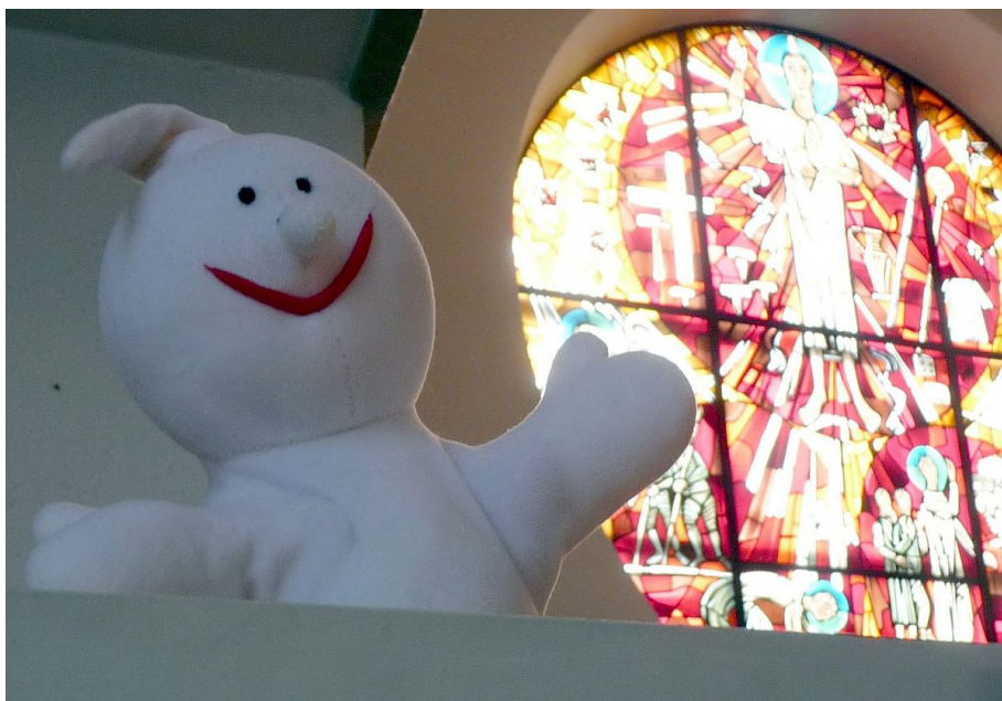
Die Handpuppe Gabi vor dem Altarfenster der Pauluskirche Gießen