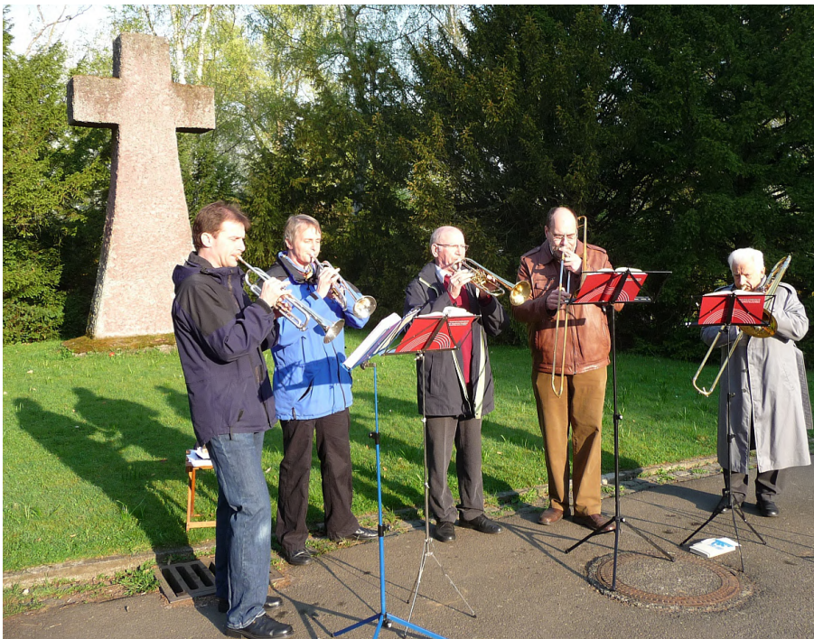
Bläserkreis am Steinkreuz auf dem Neuen Friedhof in Gießen

Vielleicht wollte Markus nicht vorschnell jubeln. In unserer Welt wird der Sohn Gottes bis heute getötet in jedem Menschen, der verhungert, und Jesus leidet mit in jedem Kind, das gequält wird. Wenn dieser Gequälte, Gekreuzigte, Begrabene auferstanden ist und vor uns hergeht nach Galiläa, also dorthin, wo unser Alltag stattfindet, dann erwartet er dort unseren Aufstand gegen alle Todesmächte.