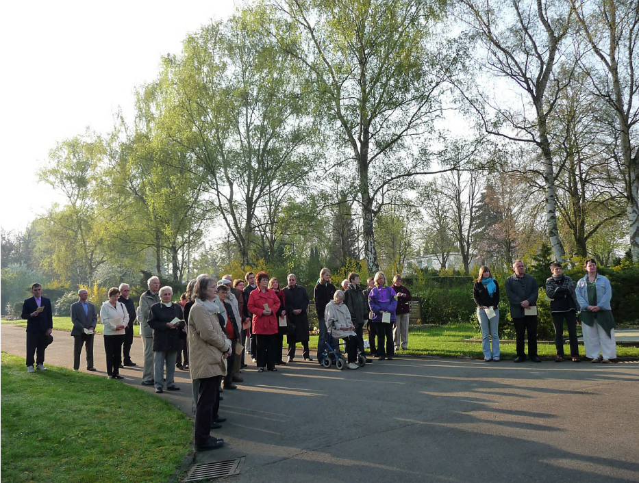
Teilnehmende an der Osterandacht um 8.00 Uhr am Streinkreuz

evangeliums dauert es, bis die Jünger endlich glauben. Den Frauen glauben sie nicht. Den Jüngern von Emmaus glauben sie nicht. Erst als der Auferstandene selbst ihnen als lebendig erscheint, fassen sie neues Vertrauen.