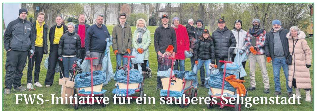
FWS-Initiative für ein sauberes Seligenstadt

Sie haben Besonderes erlebt, hören das „Gras wachsen“, sind Zeuge oder haben eine tolle Geschichte für uns. Dann melden Sie sich bitte bei unserer Redaktion: Telefon 06182/8203570 oder per Mail an redaktion(at)trackmedia.eu