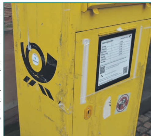
„Visitenkarte“ der Post: Igittigitt!

noch einwerfen. Nach Beobachtungen der Redaktion und Verleges des SELIGENSTÄDTERS bleiben die Kästen offenbar mitunter tagelang ungeöffnet – weshalb dort seit längerem bewusst keine Briefe mehr eingeworfen werden. Hinzu komme der äußere Zustand der Anlagen: verschmutzt, mit Aufklebern beklebt und sichtbar ungepflegt. Auch in der Postagentur in der Bahnhofstraße habe Gellerer keine konkrete Hilfe erhalten. Mitarbeiterinnen hätten erklärt, die Leerung falle nicht in ihren Zuständigkeitsbereich, da diese extern organisiert werde. Für die Betroffene bleibt der Eindruck: Niemand fühlt sich