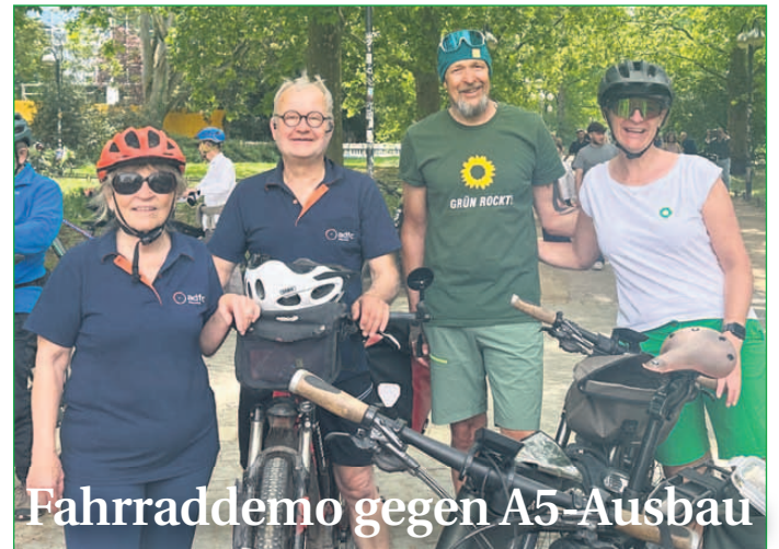
Fahrraddemo gegen A5-Ausbau