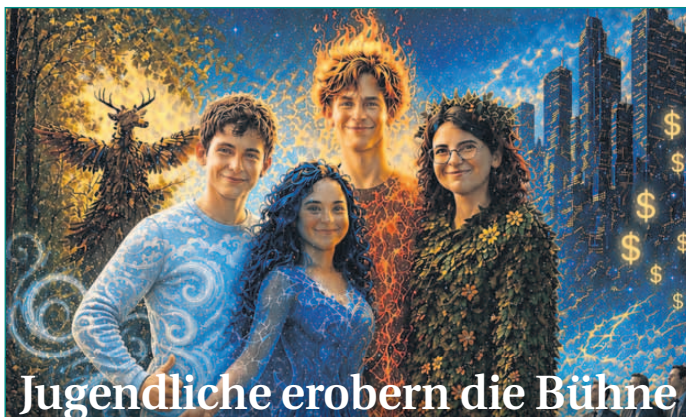
Jugendliche erobern die Bühne

Kinder der Trauergruppe der Gemeinde St. Marien Seligenstadt haben sich kreativ mit Trauer und Hoffnung beschäftigt. Ausgehend von der biblischen Geschichte Jakobs gestalteten sie nach einer Traumreise eigene kleine Himmelsleiter als Symbol für Trost und Verbindung. Die Gruppe bietet Kindern im Alter von 7 bis 12 Jahren einen geschützten Raum zum Austausch und zur Begleitung in der Trauer und trifft sich monatlich im Gemeindezentrum in Seligenstadt.