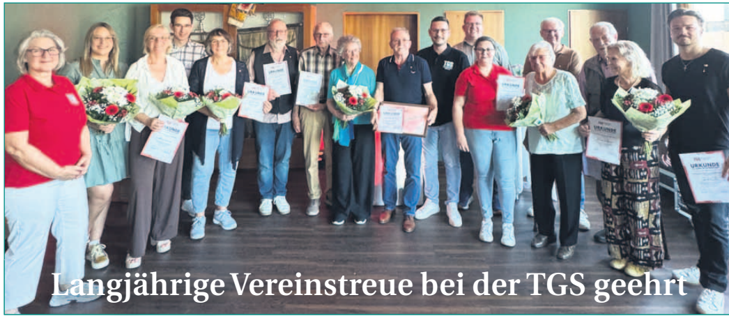
Langjährige Vereinstreue bei der TGS geehrt