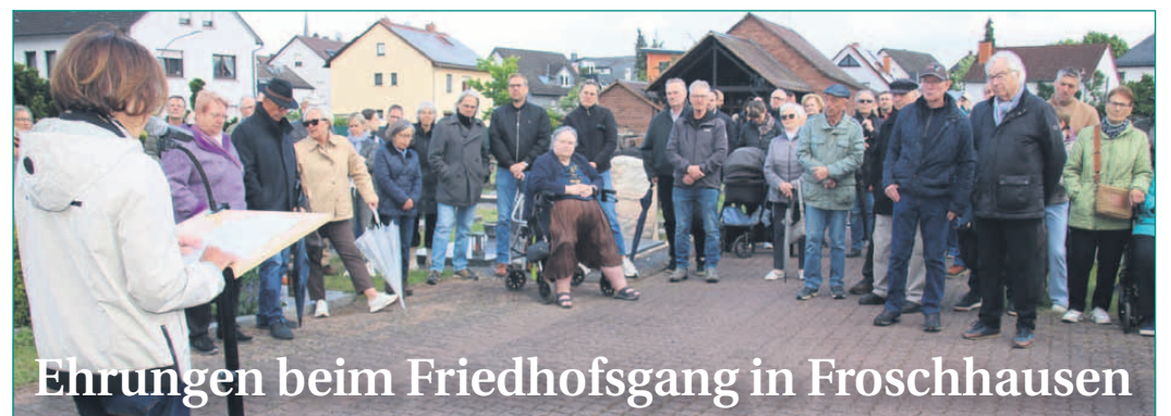
Ehrungen beim Friedhofsgang in Froschhausen

Johannesevangelium“. Besucher können dabei einzelne Verse handschriftlich abschreiben, um gemeinsam das gesamte Johannesevangelium zu gestalten. Die Aktion wird am Tag der Vereine am 20. Juni fortgesetzt. Die Gemeinde ist im Ostkreis vor allem durch ihre jährliche Kerzenziehaktion bekannt und gehört zu einer internationalen evangelischen Freikirche, die weltweit in mehr als 165 Ländern vertreten ist.