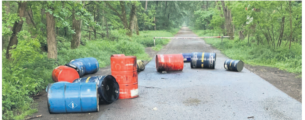
Illegal entsorgte Ölfässer im Seligenstädter Stadtwald sorgen für Umweltaarm.

Ferdinand-Porsche-Straße 16 A · 63500 SELIGENSTADT Telefon (0 6182) 899494 · www.radsport-koenig.de