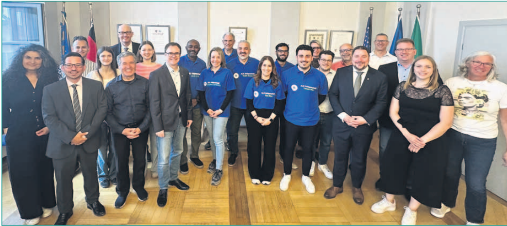
Der neue Ausländerbeirat mit der Rathausspitze im Großen Sitzungssaal des Rathauses.

Post mit einem Bewerberbogen möglich; maßgeblich ist der Eingang bei der Stadt. Spätere Bewerbungen werden nicht berücksichtigt. Informationen zu Bebauung und Verfahren sind online im KIP sowie im Rathaus verfügbar. Die Betreuung des Vergabeverfahrens erfolgt über die Terramag GmbH.