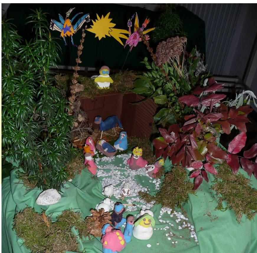
Kinder vom Kindersonntag der Evangelischen Paulusgemeinde Gießen haben diese Krippenlandschaft gestaltet

Bei der Besinnung auf das Wunder der Heiligen Nacht schauen wir uns in diesem Gottesdienst auch Szenen der Weihnachtsgeschichte an, wie sie die Kinder beim letzten Kinder-