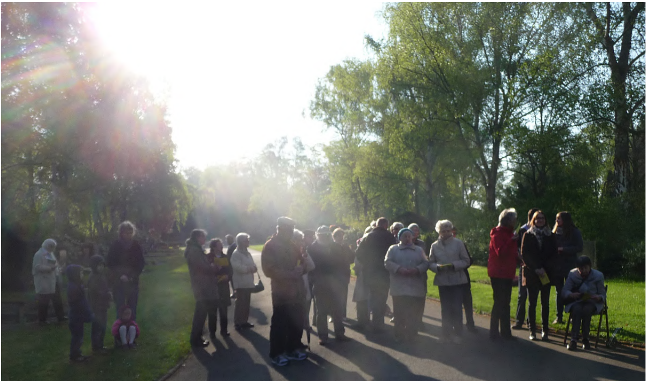
Teilnehmende an der Osterfeier 2014 am Steinkreuz in der Morgensonne

In unserem Gedächtnis soll Jesus fest eingepägt bleiben, weil in ihm das lebendige Wort der Liebe Gottes Fleisch und Blut angenommen hat. Nicht die menschliche Gestalt Jesu war vor seiner Geburt schon einmal im Himmel, sondern in dem Menschen Jesus verkörpert sich das ewige Wort Gottes, sein Geist, seine Liebe. So wird Gott mit uns Menschen solidarisch, als unser Bruder auf Erden.