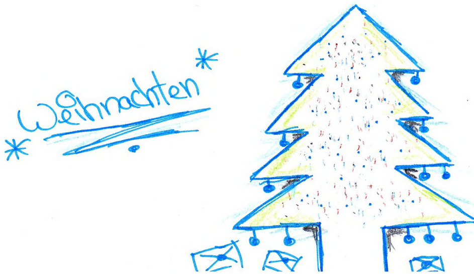
Konfis haben alle Bilder hier und auf den folgenden Seiten gestaltet

erst heute Abend. Aber was ist Weihnachten? Worin besteht das Wunder dieser Nacht?