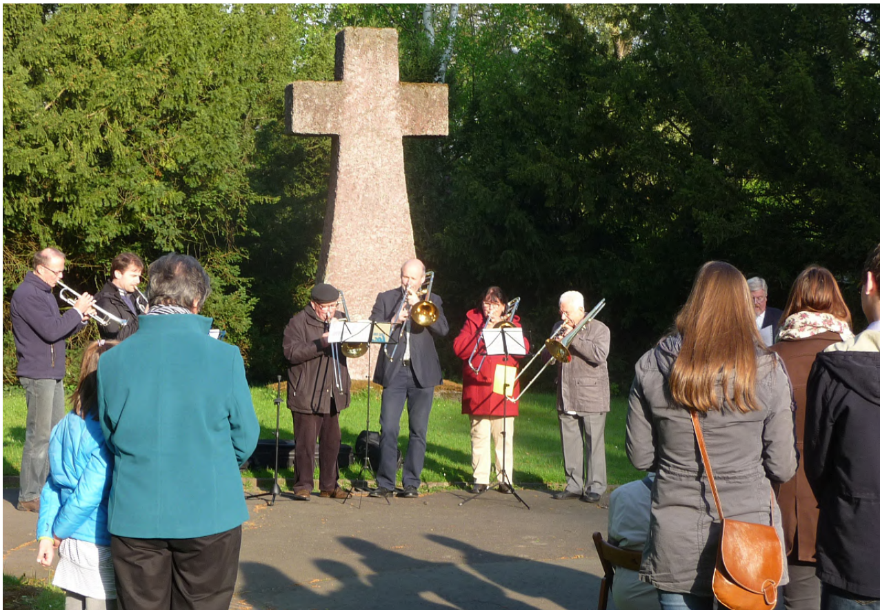
Zum ersten Mal wurde die Osterandacht am Steinkreuz ökumenisch gefeiert

Und nun beginnen wir unsere Osterfeier im Namen Gottes, des Vaters und des Sohnes und des Heiligen Geistes. Amen.