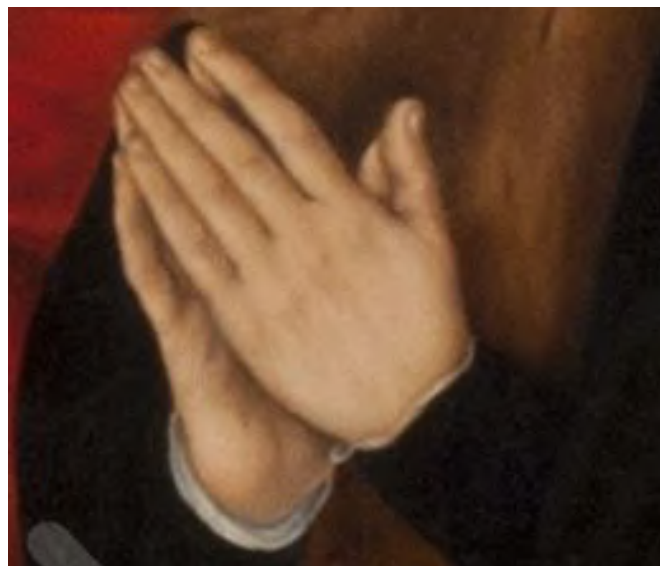
Die zum Beten zusammengelegten Hände des Malers Lucach Cranach

werfe ich in dieser Predigt auf die Hände des Malers Lucas Cranach. Er malt sie als betende Hände, zusammengelegt in dem Vertrauen, dass Gott in Jesus Christus für uns sündige Menschen alles getan hat, um uns zu erlösen, zu retten, zu befreien. Sein Bild will uns dazu anleiten, dasselbe wie er zu tun: dankbar anzuerkennen, was Gott durch das Leiden und Sterben seines Sohnes für uns getan hat, um uns zu einem Leben im Gottvertrauen und in tätiger Nächstenliebe zu befreien. Amen.