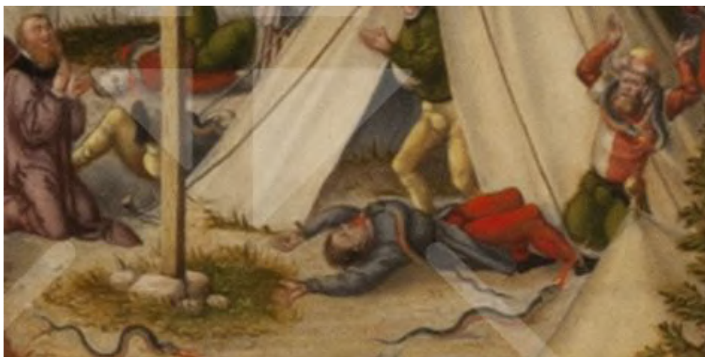
Eine Schlange speit einem, der auf dem Boden liegt, ihr Gift in den Mund.

Lucas Cranach malt diese Szene ziemlich gruselig, indem er darstellt, wie die Schlangen ihr Feuer in den Mund ihrer Opfer hineinspeien; fast sieht es aus, als ob die Schlangen hineinkriechen.