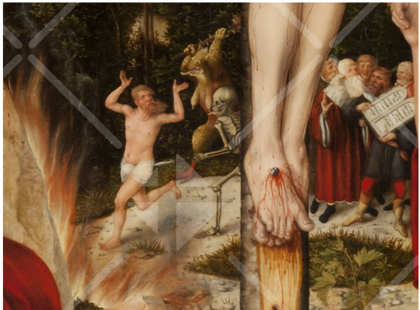
Adam kann Gottes Gebote nicht befolgen, ist gefangen zwischen Wollust, Tod und Höllenflammen

Der Maler ist überzeugt: Es ist das Blut Christi nötig, um uns aus dieser Gefangenschaft zu befreien. Aber was will er damit sagen, dass er das Blut regelrecht aus der Seitenwunde Jesu herausspritzen sieht und dass der Blutstrahl zielgenau auf dem Kopf des Lucas Cranach auftrifft?