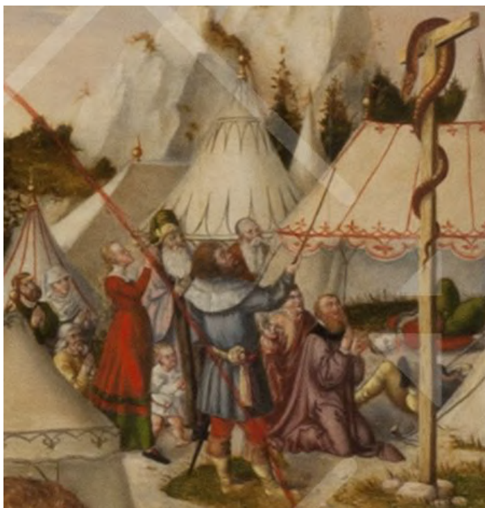
Die eherne Schlange an einem Kreuz

Oder verbrennen sie durch ihr Feuer die Seele dieses Menschen? Jedenfalls erinnern die feurigen Schlangen daran, dass Menschen, die ohne Gottvertrauen leben wollen, jederzeit Gefahr laufen, sich vor der Hölle fürchten zu müssen, vor einem Leben ohne Seele, ohne Sinn, ohne Liebe.