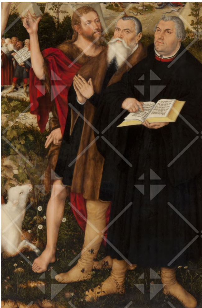
Die Hand des Täufers zeigt auf ein Lamm

Und warum steht Martin Luther neben ihm? Weil er es ist, der ganz ähnlich wie Johannes der Täufer sein ganzes Leben der Aufgabe gewidmet hat, auf die Bedeutung des Gekreuzigten für die Menschen hinzuweisen.