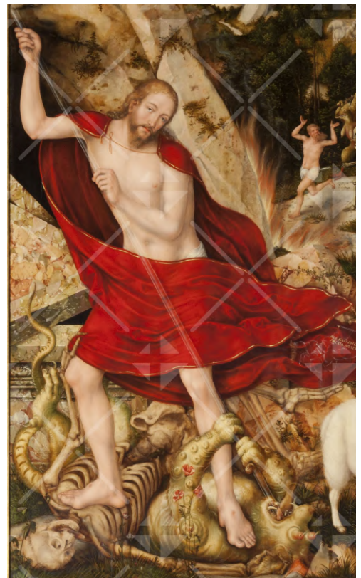
Der Auferstandene tötet wie Michael Tod und Teufel

Egal, jedenfalls ist Christus nicht mehr im Grab, sondern er ist als der Auferstandene damit beschäftigt, den Teufel zu besiegen. Lucas Cranach malt Jesus hier so ähnlich, wie auf unserem Fensterbild über der Orgelempore der Erzengel Michael dargestellt ist. Damit macht er deutlich: Wenn in der Offenbarung ein Engel den Satan besiegt, dann tut er das nicht aus eigener Kraft, sondern im Auftrag Gottes, der dem Teufel dadurch seine Macht nimmt, dass er sich aus Liebe für die Menschen hingibt und ihnen ihre Sünde vergibt. So gewalttätig es aussieht, wenn Christus in der Pose des Erzengels Michael den Satan mit einem Speer durchbohrt und tötet – diese Darstellung ist symbolisch gemeint. Der Speer ist nicht ohne Grund durchsichtig, wie ein Lichtschwert, er deutet an, dass Jesus den Teufel durchbohrt, indem er sich selbst durchbohren lässt, indem sein eigenes Blut vergossen wird.