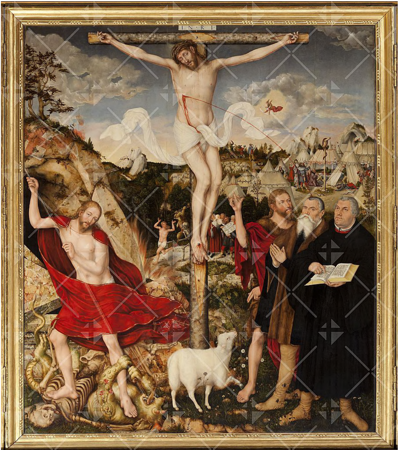
Cranach-Altar in der Stadtkirche St. Peter und Paul (Herderkirche) Weimar (es folgen nur Ausschnitte aus diesem Bild)

Beginnen wir mit den beiden Personen, die zeitlich überhaupt nicht in das Geschehen der Kreuzigung und Auferstehung Jesu hineinpassen: Lucas Cranach und Martin Luther. Hat der Maler sich selbst verewigen wollen, aus Eitelkeit? Hat er Martin Luther als evangelischem Helden ein Denkmal setzen wollen? Beides nicht mit bewuss-