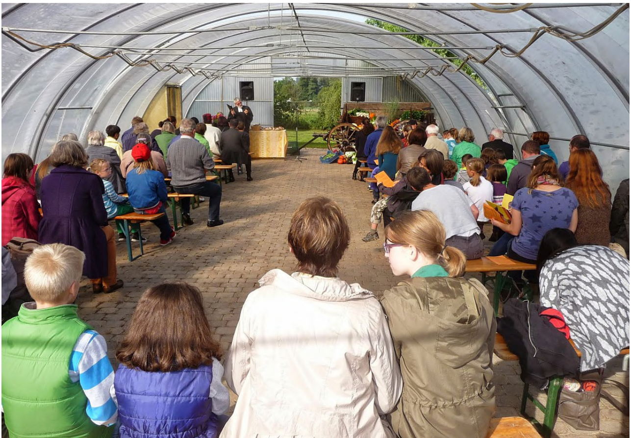
Die interreligiöse Feier zum Erntedankfest war auch im zweiten Jahr gut besucht

Gott etwas opfern, wie macht man das? Als das Volk Israel noch einen Tempel hatte, wurden dort Tiere geschlachtet oder Früchte vom Acker als Opfer verbrannt. Damit wollte man entweder Gott um Vergebung bitten für böse Dinge, die man getan hatte. Oder man wollte Gott zeigen, wie dankbar man war, und gab ihm etwas von dem zurück, was er einem geschenkt hatte. Dabei ist oft das Fleisch von dem Opfer armen Menschen gegeben worden oder man hat es gemeinsam bei einem Fest gegessen. Man tat also etwas Gutes, man teilte miteinander, man hielt richtig gut zusammen.