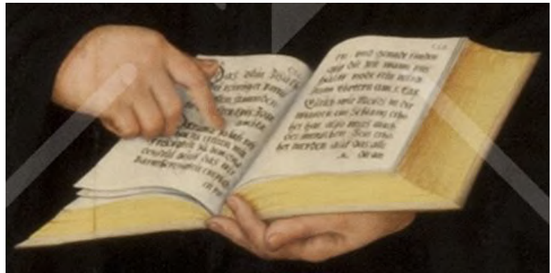
Die aufgeschlagene Bibel Martin Luthers

An dieser Stelle möchte ich einen Blick in das Buch werfen, das Martin Luther aufgeschlagen vor sich hält. Es ist die Bibel, und er zeigt auf drei Sätze, die das Geschehen am Kreuz für uns deuten. Der erste Satz steht in dem Brief 1. Johannes 1, 7 :