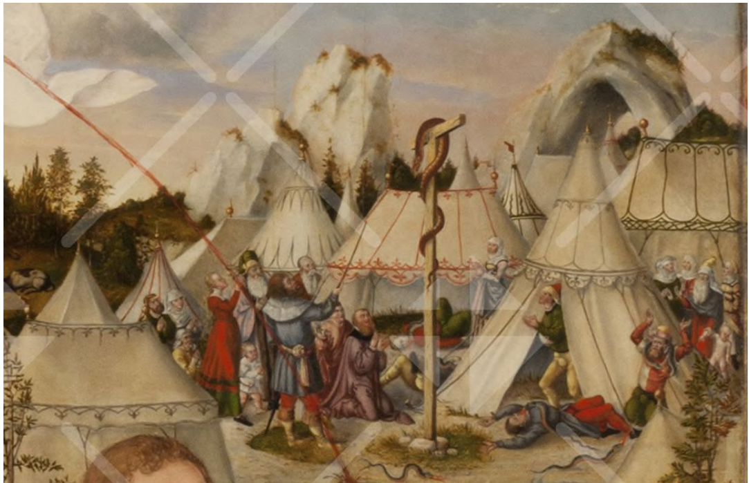
Gift und Feuer speiende Schlangen zwischen den Zelten Israels

Zwischen den Zelten Israels sieht man giftige Schlangen, vor denen