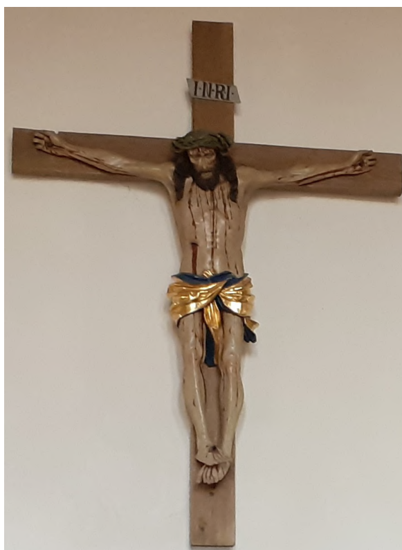
Das Kruzifix an der Rückwand der evangelischen Kirche in Reichelsheim/Wetterau

Andere Christen machen sich gar nicht viele Gedanken um das Leiden und das Kreuz Jesu, für sie ist wichtiger, was Jesus gesagt und getan hat, dass er Arme und Ausge-