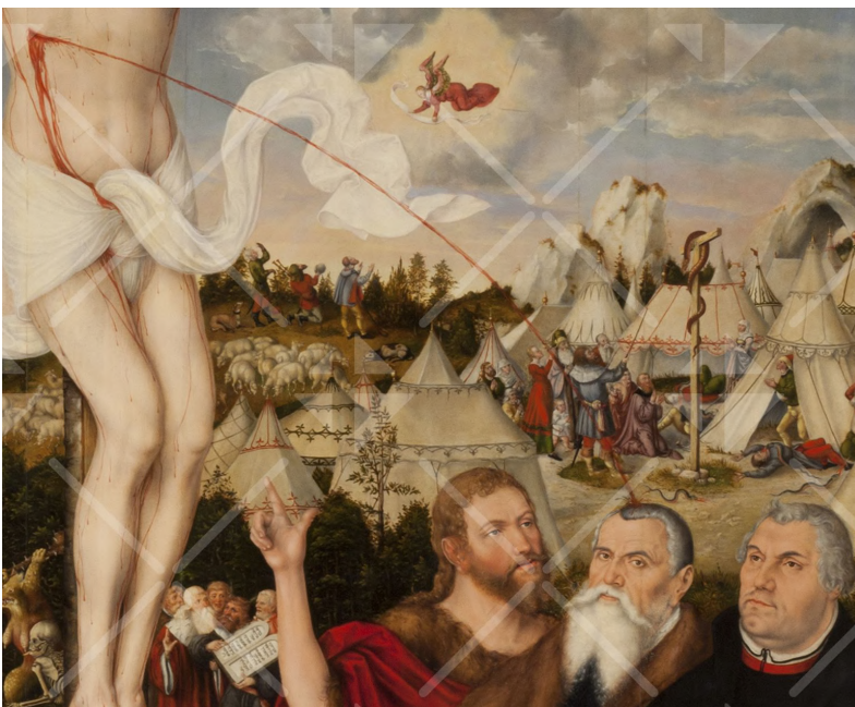
Das Blut aus der Seitenwunde Jesu spritzt auf den Kopf von Lucas Cranach