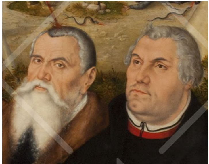
Lucas Cranach und Martin Luther

Schauen wir etwas tiefer, so sehen wir nicht nur, dass die beiden Männer der beginnenden Neuzeit im Gegensatz zu Johannes dem Täufer Beinkleider tragen und sich dennoch eng mit ihm verbunden wissen, sondern auch, dass der Täufer nicht nur mit seiner rechten Hand zum Gekreuzigten zeigt, sondern auch mit seiner linken zu einem Schaf, das vor ihm steht und wie zum Gruß ein Vorderbein erhebt. Hier erinnert der Maler an das Wort von Johannes dem Täufer ( Johannes 1, 29 ):