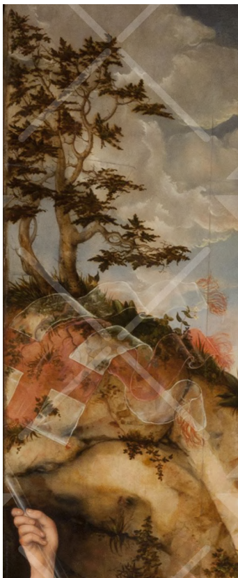
Leichentücher im Wind

Egal, jedenfalls ist Christus nicht mehr im Grab, sondern er ist als der Auferstandene damit beschäftigt, den Teufel zu besiegen. Lucas Cranach malt Jesus hier so ähnlich, wie auf unserem Fensterbild über der Orgelempore der Erzengel Michael dargestellt ist. Damit macht er deutlich: Wenn in der Offenbarung ein Engel den Satan besiegt, dann tut er das nicht aus eigener Kraft, sondern im Auftrag Gottes, der dem Teufel dadurch seine Macht nimmt, dass er sich aus Liebe für die Menschen hingibt und ihnen ihre Sünde vergibt. So gewalttätig es aussieht, wenn Christus in der Pose des Erzengels Michael den Satan mit einem Speer durchbohrt und tötet – diese Darstellung ist symbolisch gemeint. Der Speer ist nicht ohne Grund durchsichtig, wie ein Lichtschwert, er deutet an, dass Jesus den Teufel durchbohrt, indem er sich selbst durchbohren lässt, indem sein eigenes Blut vergossen wird.